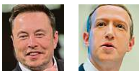
Majitelé sociálních sítí E. Musk a M. Zuckerberg

Zápas dvou z nejvýznamnějších technologických miliardářů světa, šéfa X Elona Muska a ředitele společnosti Meta, která vlastní mimo jiné síť Facebook, Marka Zuckerberga, bude živě přenášán na sociální síti X, dříve známé jako Twitter. Uvedl to ve svém příspěvku na sociální síti Elon Musk. Oba magnáti se v červnu přes internet domluvili na zápase v kleci. Místem má být oktagon v Las Vegas, kde se konají mistrovské zápasy ve smíšených bojových uměních (MMA). Zápas Zuck vs. Musk bude živě přenášán na X. Veškerý výnos půjde na charitu pro veterány. Devětatřicetile-