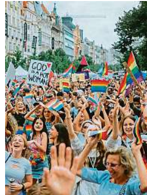
Festival probíhá na různých místech po celé metropoli. P.PRIDE

Například v současnosti se často mluví o trans gender lidech. Podle Černé je slovo transsexuál zavádějící a nevhodné, jelikož se váže k diagnóze. „U trans lidí jde o přeměnu identity, ne sexuality. Dále je například třeba rozlišovat mezi trans ženou a drag queen. Zatímco být trans je