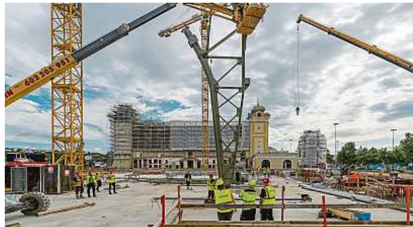
Zdvih prvního pilíře levého křídla unikátní stavby. Ta prochází kompletní rekonstrukcí.