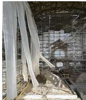
Fotky na Metro.cz

Na svou dobu se jednalo o unikátní projekt. Stavaři udělali další krok k jeho obnově.