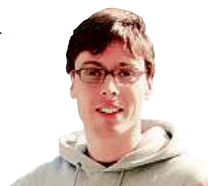
MARDOŠA ČLEN KAPELY TATA BOJS

Na benzince jsem potom zjistil, že celé auto je napěněné a značně zapáchá. Naštěstí jen zvenku. Zavřeli jsme se tedy uvnitř a vyrazili. Nečekané nám pomohla nepříznivá počasí. Silný déšť brzy všechny zbytky močoviny, čpavku a AdBlue smyl. Naše cestování má styl!