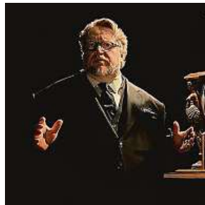
Guillermo del Toro coby Hitchcockův nástupce 2x NETFLIX

Než přikročím k hodnocení jednotlivých epizod, přiblížím vám ještě stylově sjedno-