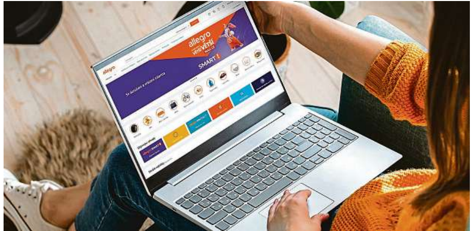
Na portálu Allegro.cz nakoupíte z pohodlí vašeho domova téměř cokoli. Od elektroniky přes hračky pro děti až po módní oblečení a doplňky.

Nejde však pouze o sportovní pomůcky či zahradní vybavení, ale také o elektroniku, módu nebo třeba produkty z oblasti auto-moto. Na Allegro.cz nakoupíte vše pod jednou střechou, a to za využití ověřených a oblíbených dopravců v čele s WE|DO, Zásilkovnou, DHL či DPD. Allegro si navíc pro české spotřebitele připravilo také program Smart! fungující na bázi před-