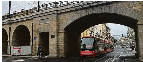
Další důležitá proměna Karlína. Jako první přijde na řadu oblouk u Sokolovské ulice.