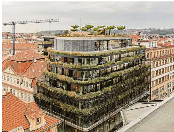
Palác Drn se nachází na nároží Národní třídy a Mikulandské ulice. Slouží jako kanceláře, restaurace, obchody a galerie.

Budova Drn je mezi veřejností považována za kvalitní architekturu a na kolemjdoucí působí příjemně až inspirativně. „Lidé tady chtějí pracovat i trávit čas, což potvrzují plně kanceláře i restaurace. Snažím se čím dál víc, aby má práce spojovala lidi s příro-