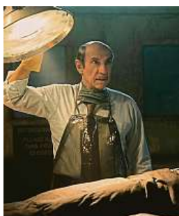
F. Murray Abraham v Pitvě