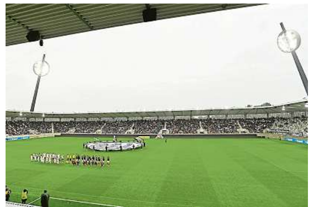
O víkendu přišlo na ligu celkem 70 022 diváků, což znamená rekord za jedno kolo v tomto tisíciletí. Pomohl i nový stadion v Hradci.