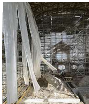
Fotky na Metro.cz

Na svou dobu se jednalo o unikátní stavbu. Stavaři udělali další krok k jeho obnově.