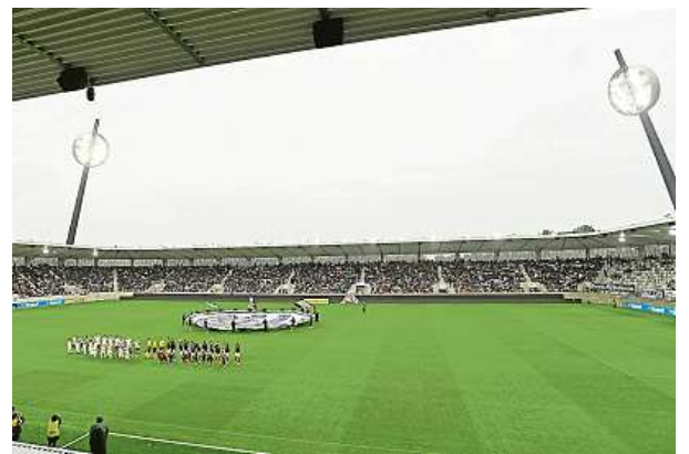
Fotbalisté Hradce Králové si na novém stadionu zastříleli, když porazili České Budějovice jasně 5:1.

Také Mladoboleslavští rozhodli v Karviné o výhře 2:1 na začátku zápasu. Už v úvodní dvacetiminutovce se trefili Lamin Jawo a Júsuf Hilál, v 70. minutě snížil Rajmund Mikuš. Středočeský celek udržel v nové sezoně neporazitelnost. Olomouci pomohly k výhře 2:0 v Uherském Hradišti góly po chybách domácí defenzivy v úvodu obou poloča-