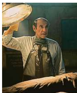
F. Murray Abraham v Pitvě