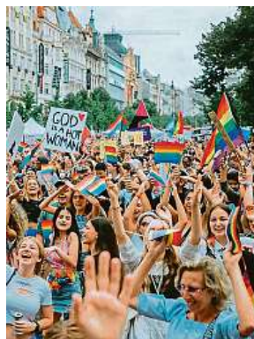
Festival probíhá na různých místech po celé metropoli. P. PRIDE

Například v současnosti se často mluví o trans gender lidech. Podle Černé je slovo transsexuál zavádějící a nevhodné, jelikož se váže k diagnóze. „U trans lidí jde o přeměnu identity, ne sexuality. Dále je například třeba rozlišovat mezi trans ženou a drag queen. Zatímco být trans je