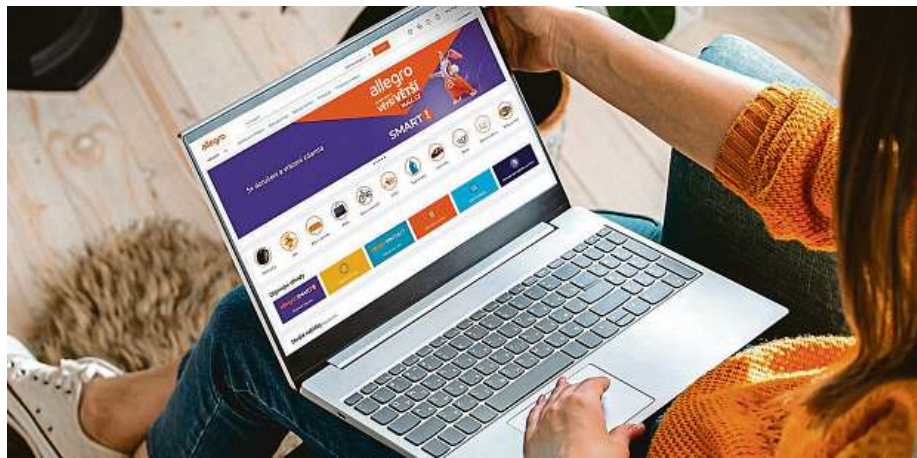
Na portálu Allegro.cz nakoupíte z pohodlí vašeho domova téměř cokoliv. Od elektroniky přes hračky pro děti až po módní oblečení a doplňky.

Nejde však pouze o sportovní pomůcky či zahradní vybavení, ale také o elektroniku, módu nebo třeba produkty z oblasti auto-moto. Na Allegro.cz nakoupíte vše pod jednou střechou, a to za využití ověřených a oblíbených dopravců v čele s WE|DO, Zásilkovnou, DHL či DPD. Allegro si navíc pro české spotřebitele připravilo také program Smart! fungující na bázi před-