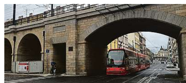
Další důležitá proměna Karlína.