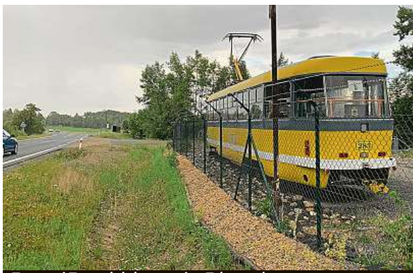
Tramvaj T3 nedaleko vesnice Trhomné