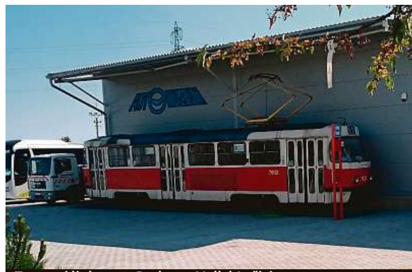
Tramvaj linky 22 z Prahy ve Velké Lečici