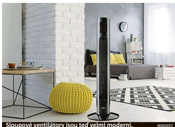
Sloupcové ventilátory jsou teď velmi moderní.

Jak správně tušíte, v dnešním článku se vrátíme k ventilátorům. Konkrétně si připomeneme portfolio značky Domo, které nás zaujalo produkty nevídané kvality a skvělými cenami. V nabídce najdete jak klasické vrtulové ventilátory, tak moderní slou-