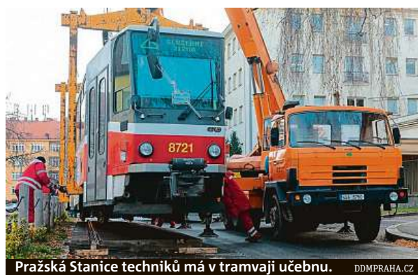
Pražská Stanice techniků má v tramvaji učebnu.