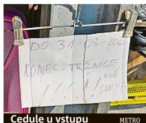
Cedule u vstupu