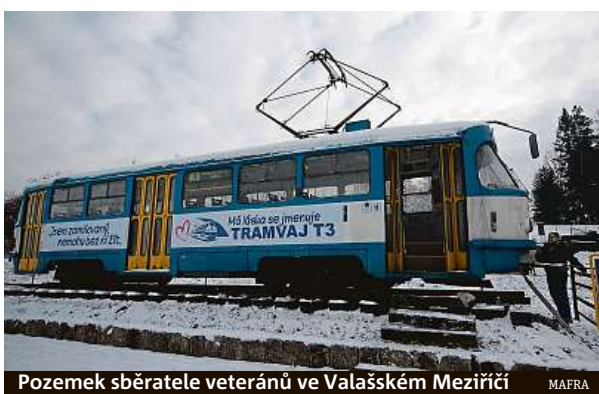
Pozemek sběratele veteránů ve Valašském Meziříčí