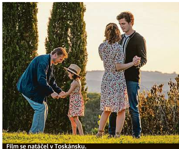
Film se natáčel v Toskánsku.