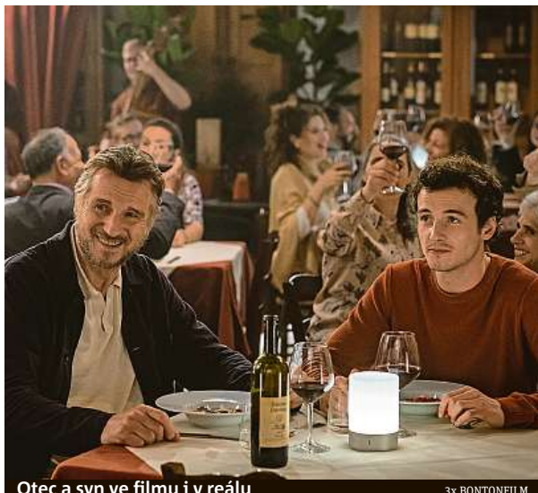
Otec a syn ve filmu i v realu

Richardson: Je třeba tomu být otevřený. Byl to životní zážitek. MET