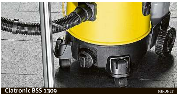
Clatronic BSS 1309

Na výkonu a výbavě záleží. To platí i v případě něčeho tak triviálního, jako je vysavač.