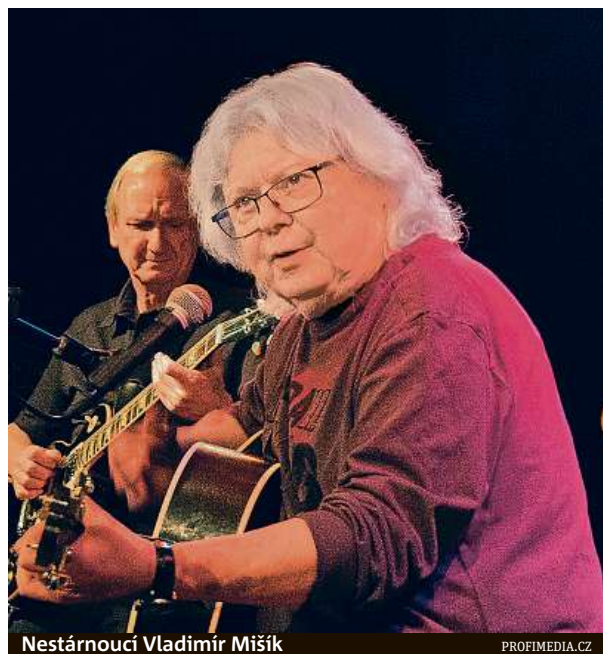
Nestárnoucí Vladimír Mišík

Putovní festival se od pátku do soboty odehraje pod brněnským hradem Veveří. Ústředním tahákem je kapele Kryštof, která se na Hra-