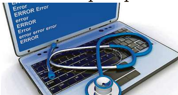
Reinstalace systému je potřebná.

Důvodem může být příliš mnoho operací běžících na pozadí, zbytečné pozůstatky již odinstalovaných aplikací nebo třeba počítačové viry i jiné kybernetické hrozby. U notebooků potom větší zátež přispívá k přehřívání