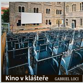
Kino v klášteře GABRIEL LOCI

Matrix, Divoké historky, Poslední skaut nebo například Amélie z Montmarturu. Letní kino v bývalém komplexu kláštera sv. Gabriela na pražském Smíchově promítá letos v létě jeden trhák za druhým. Prostor Gabriel Locí chystá na prázdniny kromě filmových představení také například divadlo,