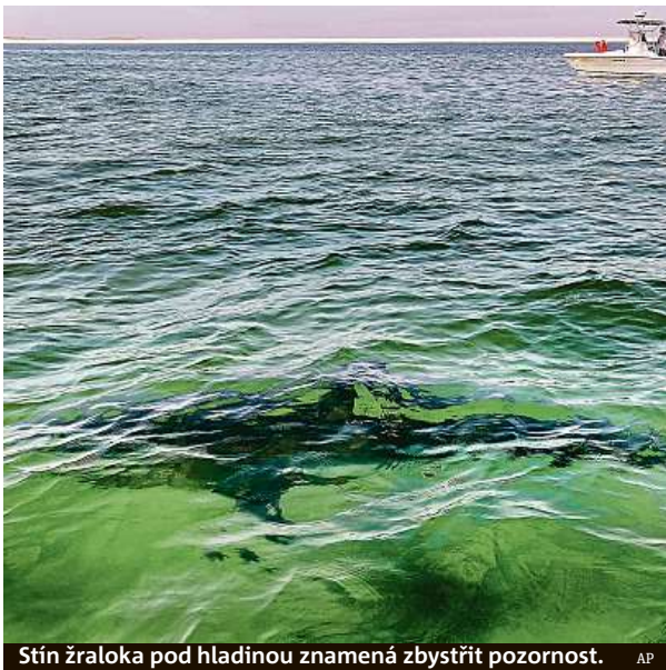
Stín žraloka pod hladinou znamená zbystřit pozornost.