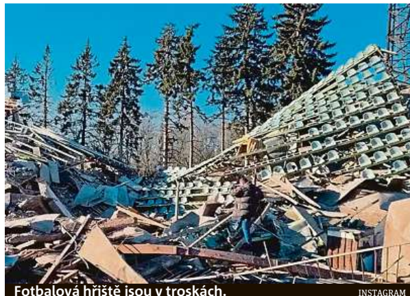
Fotbalová hřiště jsou v troskách.

Situaci v Charkově, městě velkém jako Praha, ilustruje i videozáznam agentury Reu-