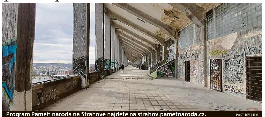
Program Paměti národa na Strahově najdete na strahov.pametnaroda.cz.

Celý program na Strahově vyvrcholí na přelomu září a října třídenním Festivalem Paměti národa. MET