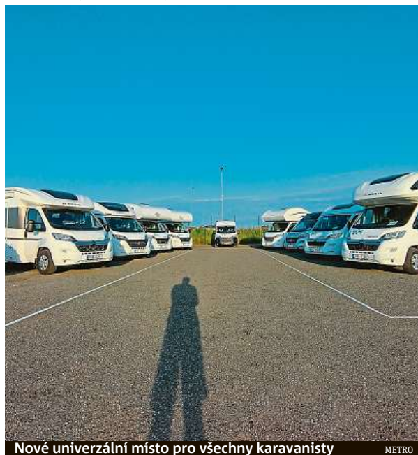
Nové univerzální místo pro všechny karavanisty

Nová základna sídlí poblíž Letiště Václava Havla a umožňuje tak snadnou dostupnost všem majitelům i řidičům karavanů během jejich cestování napříč Českem, ale i Evropou. Vlastníci obytných vozů zde mohou využít například pneuservis, zakoupit vybrané doplňky a dát si je namontovat, nechat svůj vůz připravit na STK nebo na zimní či letní sezonu. Do budoucna zde plánují zprovoznit také malý stellplatz. HOPE