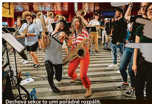
Dechová sekce to umí pořádně rozpálit.