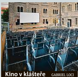
Kino v klášteře GABRIEL LOCI

Matrix, Divoké historky, Poslední skaut nebo například Amélie z Montmarturu. Letní kino v bývalém komplexu kláštera sv. Gabriela na pražském Smíchově promítá letos v létě jeden trhák za druhým. Prostor Gabriel Locí chystá na prázdniny kromě filmových představení také například divadlo,