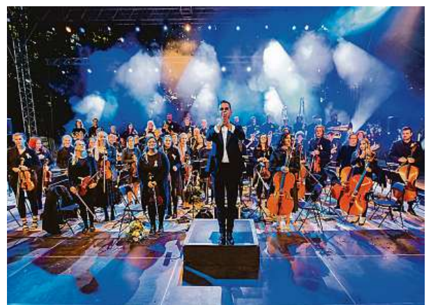
Soubor má přes 60 členů.

A nejinak tomu bude na pražském Výstavišti, kde to nejlepší ze svého zejména večírkového repertoáru opřou o stálé i hostující pěv-