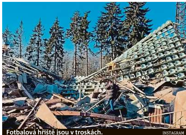
Fotbalová hřiště jsou v troskách.

Situaci v Charkově, městě velkém jako Praha, ilustruje i videozáznam agentury Reu-