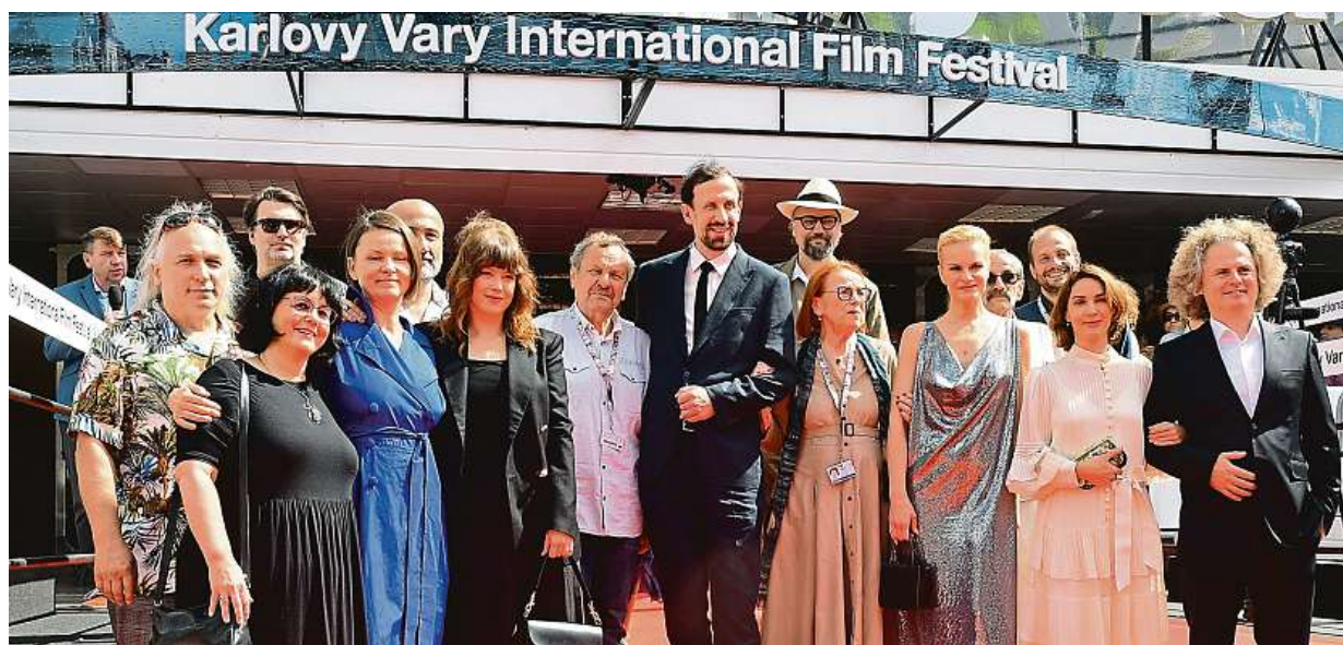
V Karlových Varech měl včera premiéru film režiséra Miroslava Krobota Velká premiéra. Více o dění na festivalu na straně 5. ČTK

Egypt. Cestovní kanceláře zaznamenaly pouze minimum obav českých klientů. Hurghada. Jen několik lidí požádalo o přestěhování do jiné lokality. Další cesty. Storna se nekonají. Jadran. Problémy se splašky STRANA 6