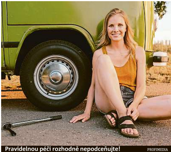
Pravidelnou péčí rozhodně nepodceňujte!

Pneu pro dodávková vozidla mají standardně označení písmenem C jako Commercial za rozměrem pneu, například 235/65 R16C. Pneumatiky vhodné pro obytná vozidla bývají označovány písmenem CP alias Camping.