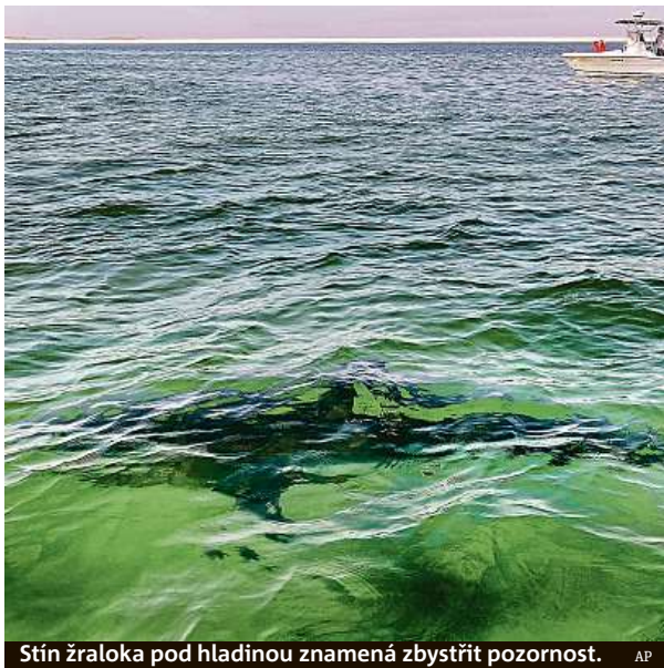
Stín žraloka pod hladinou znamená zbystřit pozornost.