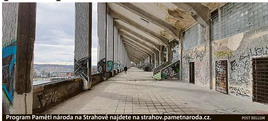
Program Paměti národa na Strahově najdete na strahov.pametnaroda.cz.

Celý program na Strahově vyvrcholí na přelomu září a října třídenním Festivalem Paměti národa. MET