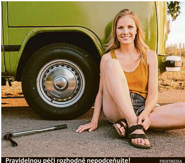
Pravidelnou péčí rozhodně nepodceňujte!

Pneu pro dodávková vozidla mají standardně označení písmenem C jako Commercial za rozměrem pneu, například 235/65 R16C. Pneumatiky vhodné pro obytná vozidla bývají označovány písmenem CP alias Camping.