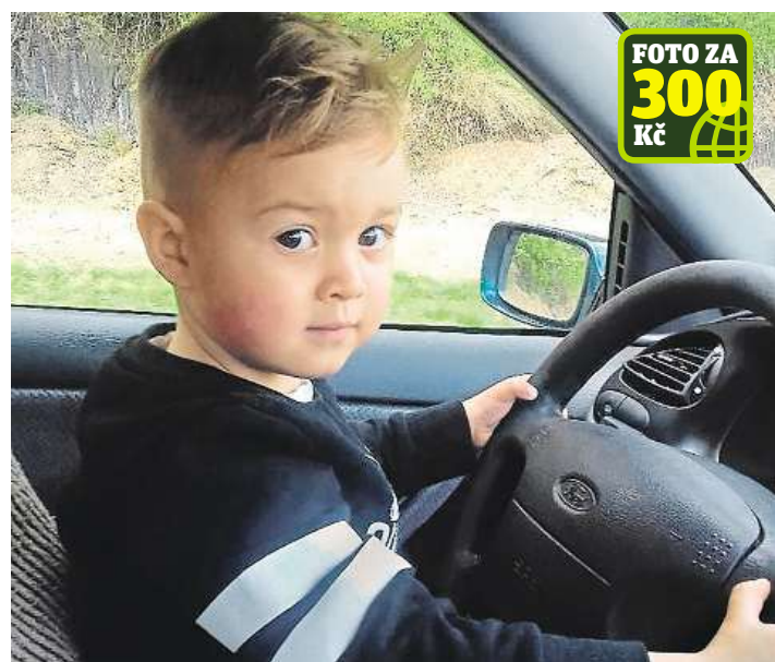
FOTO ZA 300 KČ