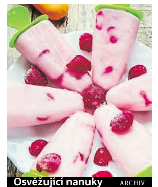
Osvěžující nanuky

Než se maso připraví, využijte čas efektivně. Své oblíbené omáčky, dipy nebo přílohy umístěte na plech k pečení muffinů. Barbecue bude vypadat stylově a navíc ušetříte spoustu mistichek, protože budete mít všechny suroviny při sobě.