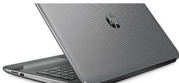
Notebook HP 255 G5

Model 255 G5 potěší matnou úpravou 15,6" obrazovky s HD rozlišením, takže vás při