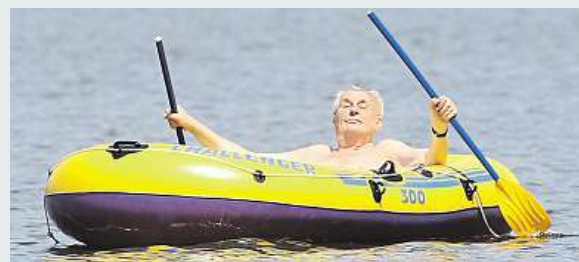
Zeman si užívá dovolenou.

Prezident Miloš Zeman i letos dodržel prázdninovou tradici. Krátce po čtvrtém polední spustili jeho bodyguardi na hladinu rybníka v Novém Veselí na Vysočině gumový člun. Na prezidentovu plavbu se přišlo podívat i několik místních. Mezi nimi byla také skupinka dívek, které Zemanovi řekly, že jsou jeho fanyнкy. Zeman má dovolenou od začátku července a skončí začátkem srpna. IDNES.cz