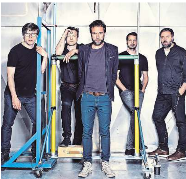
Na podzim oživí Tata Bojs desku Futuretro.

Koncerty na Colours of Ostrava jsou dlouhodobě jedny z našich nejlepších. Aspoň tedy z našeho pohledu. Organizátoři nám dávají vždy hezký večerní čas na jednom z hlavních pódii. Před dvěma lety jsme hráli tak pro patnáct dvacet tisíc lidí a byl to velký zážitek. To se nám běžně nestává. Tak jsme se rozhodli letos přivést na Colours nějaký bonus.