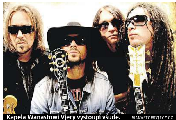
Kapela Wanastowi Vjegy vystoupí všude.

Specialitou brněnské zastávky 19. srpna bude jedinečné vystoupení Karla Gotta a také spolupráce s brněnskou fotbalovou ikonou, Petrem Švancarou. Koupí vstupenky přes jeho webové stránky mohou fanoušci při-