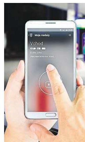
Kontrola přes mobil

První rok navíc nezplatíte za službu ani korunu, po uplynutí dvanácti měsíců vyjde provoz na velmi pěkných 590 korun ročně. Velikou předností systému Doorito je také mimořádně dlouhá výdrž baterie, která na jedno nabití vydrží v provozu až po dobu půl roku. Poté Doorito jednoduše opět dobijete pomocí běžného USB kabelu.