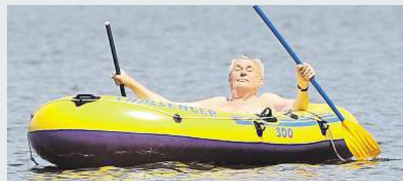
Zeman si užívá dovolenou.

Prezident Miloš Zeman i letos dodržel prázdninovou tradici. Krátce po čtvrtém polední spustili jeho bodyguardi na hladinu rybníka v Novém Veselí na Vysočině gumový člun. Na prezidentovu plavbu se přišlo podívat i několik místních. Mezi nimi byla také skupinka dívek, které Zemanovi řekly, že jsou jeho fanyнкy. Zeman má dovolenou od začátku července a skončí mu na konci týdne. IDNES.cz