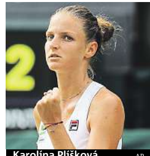
Karolína Plíšková