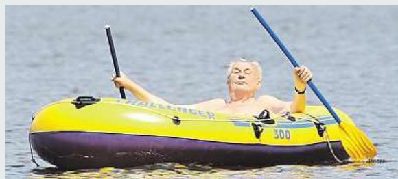
Zeman si užívá dovolenou.

Prezident Miloš Zeman i letos dodržel prázdninovou tradici. Krátce po čtvrtém poledním spustili jeho bodyguardi na hladinu rybníka v Novém Veselí na Vysočině gumový člun. Na prezidentovu plavbu se přišlo podívat i několik místních. Mezi nimi byla také skupinka dívek, které Zemanovi řekly, že jsou jeho fanyнкy. Zeman má dovolenou od začátku července a skončí mu na konci týdne. IDNES.cz