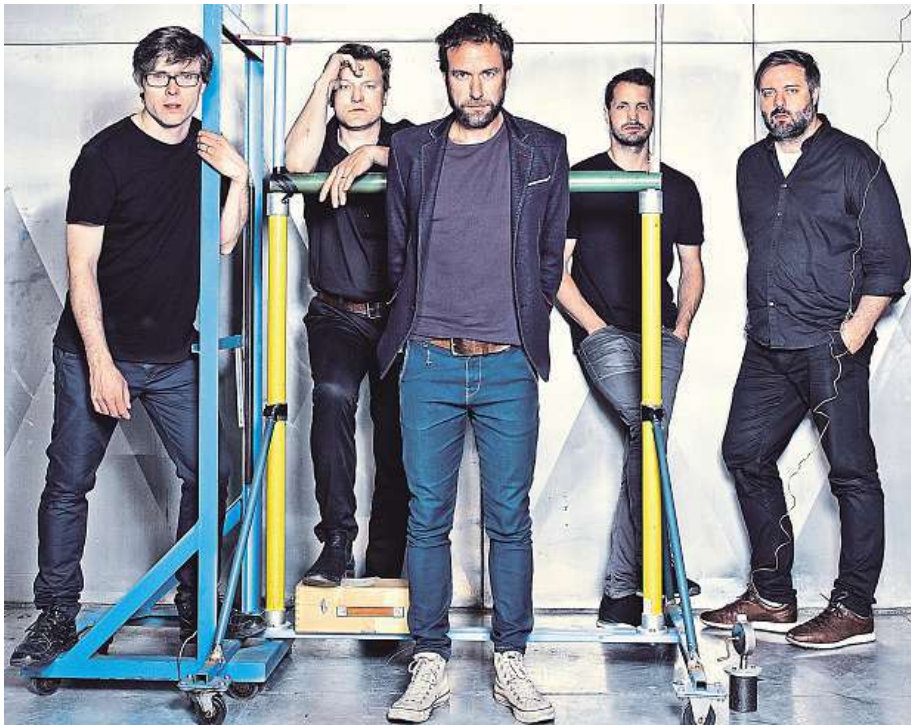
Na podzim oživi kapela Tata Bojs svou 17 let starou desku Futuro.

Projekce jako takové zas tak jiné (kromě asi dvou písniček) nebudou. Základ vychází z našich původních synchronních projekcí, které s námi už léta piluje dvorní vizuální