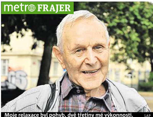
Moje relaxace byl pohyb, dvě třetiny mé výkonnosti. LAP

Později i závodil za Sokol jako žák. „Vzpomínám si na slet v roce 1938. Bylo to těsně před válkou a i my děti jsme cí-