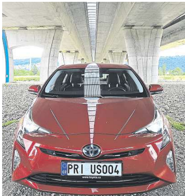
Vypadá ulítle, ale překvapí svými vlastnostmi.