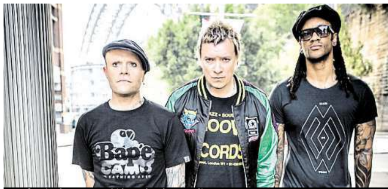
Na festivalu vystoupí i kapela The Prodigy.