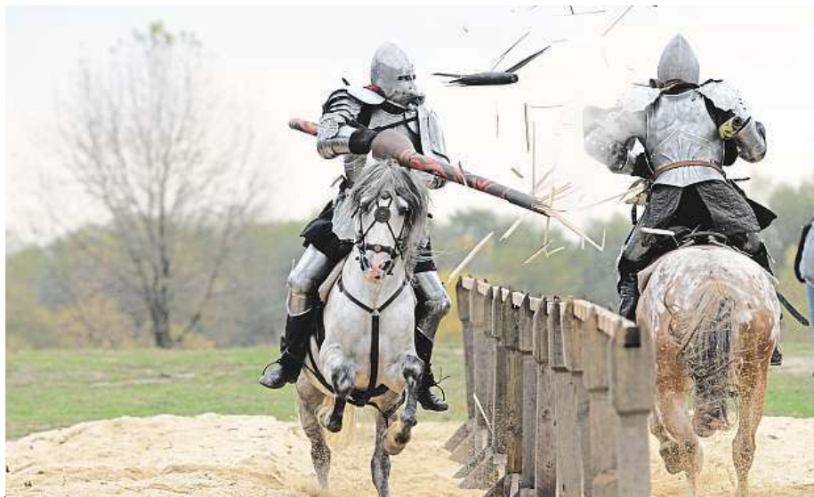
Rytířské slavnosti nabídl i minulý rok řadu zajímavých momentů.