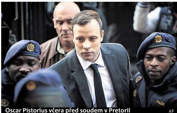
Oscar Pistorius včera před soudem v Pretorii