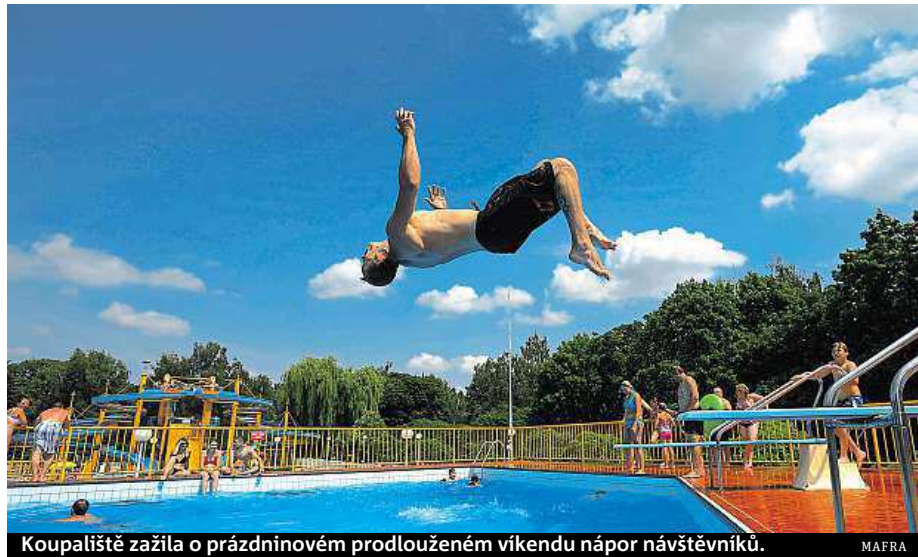
Koupaliště zažila o prázdninovém prodlouženém víkendu nápor návštěvníků.

Prodloužený víkend lákal k vodě, šest lidí koupání nepřežilo. I kvůli alkoholu.