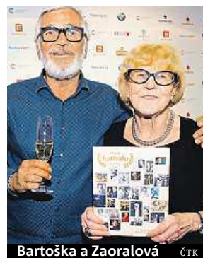
Bartoška a Zaoralová

„Má publikace není žádným historickým materiálem. Šlo