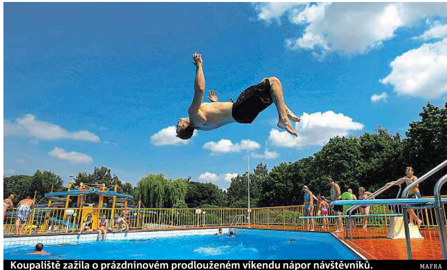
Koupaliště zažila o prázdninovém prodlouženém víkendu nápor návštěvníků.

Prodloužený víkend lákal k vodě, šest lidí koupání nepřežilo. I kvůli alkoholu.