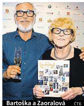
Bartoška a Zaoralová

„Má publikace není žádným historickým materiálem. Šlo