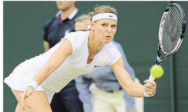
Šafářová se letos v Anglii střetla se třemi Američankami. AP

Oštěpařka Barbora Špotáková ovládla sobotní pařížský mítink Diamantové ligy. Výkonem 64,42 metru si zlepšila letošní maximum o dvaatřicet centimetrů. IDNES.cz