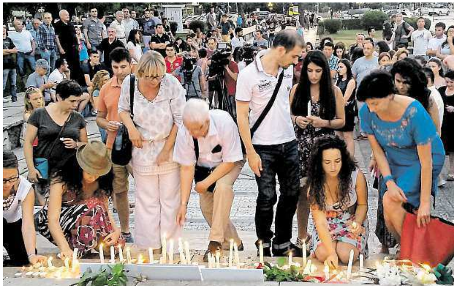
Pietního shromáždění v Tiraně se zúčastnily desítky lidí.