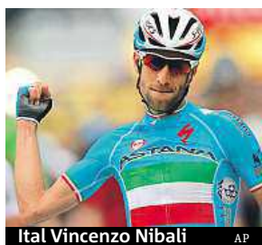
Ital Vincenzo Nibali

Druhou etapu Tour de France s cílem v Sheffieldu vyhrál italský cyklista Vincenzo Nibali a oblékl se do žlutého trikotu lídra závodu. Bývalý šampion z Vuelty a Gira d'Italia si připsal první etapové vítězství na Tour v kariéře. Devětadvacetiletý Nibali vyhrál díky úspěšnému úniku zhruba dva kilometry před cílem etapy, jež cyklisty vedla 201 km z Yorku přes devět různě náročných stoupání. Další místa obsadili Belgičan Greg van Avermaet a Polák Michal Kwiatkowski. Český favorit na celkové umístění Leopold König dojel do cíle devětadvacátý. Třidenní britský úvod Tour dnes zakončí etapa s cílem v Londýně. čtk