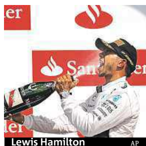
Lewis Hamilton

Velkou cenu Británie, devátý závod mistrovství světa vozů formule 1, vyhrál domácí jezdec Lewis Hamilton ze stáje Mercedes. Jeho týmový kolega Nico Rosberg z Německa poprvé v sezoně nedejel, přesto se udržel v čele průběžného hodnocení šampionátu. Do cíle závodu, který byl po startu na více než hodinu zastaven kvůli vážné nehodě Kimiho Räikkönena, dojel druhý Fin Valtteri Bottas na williamsu, a navázal tak na třetí místo v minulém dílu v Rakousku, i když do závodu odstartoval až ze čtrnácté pozice. Zaznamenal tak nejlepší výsledek kariéry. Třetí byl Australan Daniel Ricciardo z Red Bullu. čtk