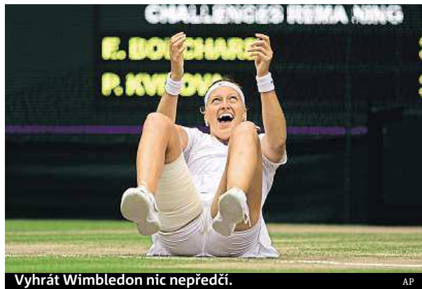
Vyhrát Wimbledon nic nepředčí.

dání v tom nejnevhodnějším okamžiku, tedy když Djokovič vedl 5:4. Srb odskočil v poslední hře hned na začátku a Federerovi už nedovolil ani vyrovnat. Ze dvou breakballů využil hned ten první a zvítězil 6:4. METRO