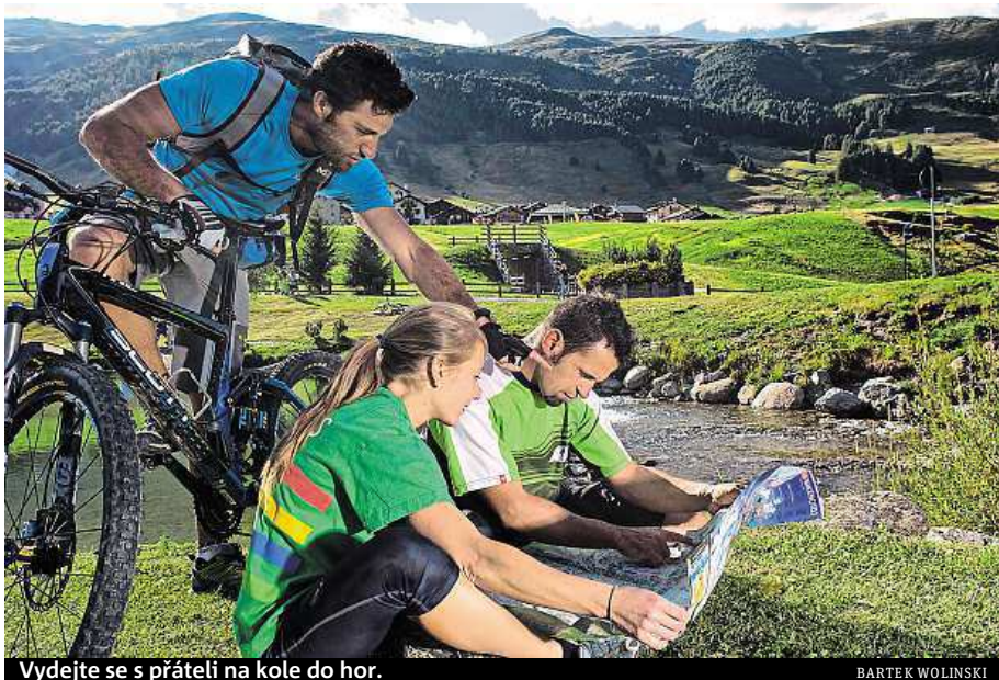
Vydejte se s přáteli na kole do hor.

Do karet Livignu hraje i to, že v létě je toto vysokohorské údolí zalito sluncem – má vel-