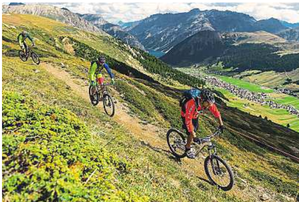
Do Itálie za sportem