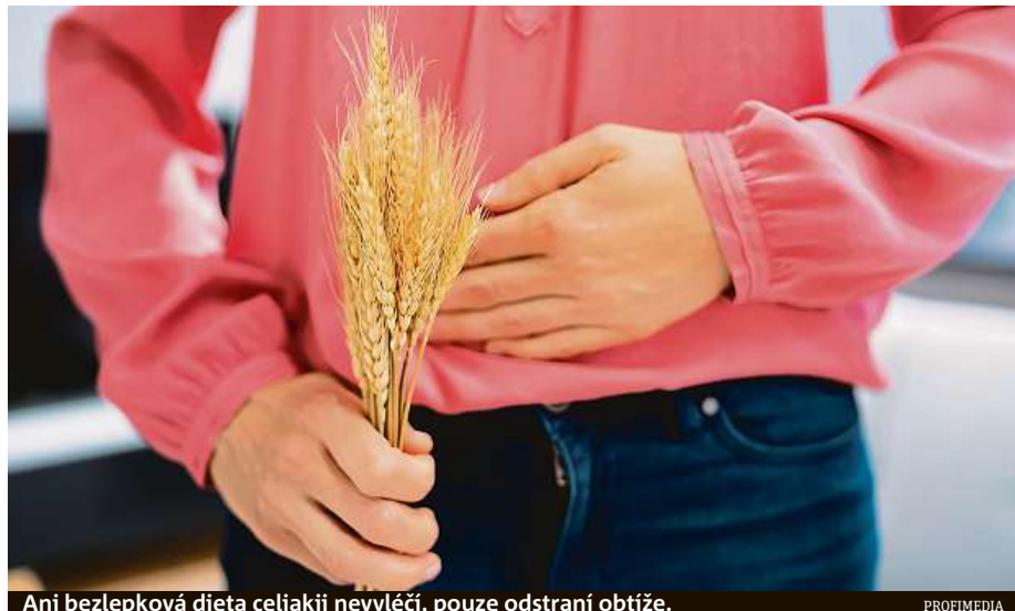
Ani bezlepková dieta celiakii nevyлéčí, pouze odstraní obtíže.