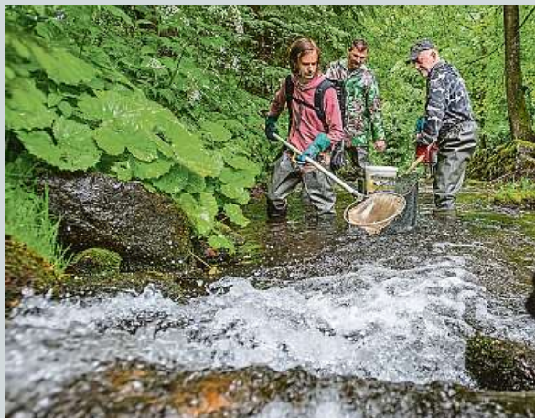
Ichtyologové odlovili pomocí elektrického agregátu především pstruhy.

V tomto týdnu bude počátek převládat oblačné počasí s deštěm a přeháňkami, ojediněle se objeví i bouřky. Nejvyšší teploty se budou většinou pohybovat jen lehce nad 20 stupni. O víkendu se obloha vyjasní a teploty od pátku porostou až k 29 stupňům. Vyplývá to z týdenní předpovědi českých hydro-meteorologů. ČTK