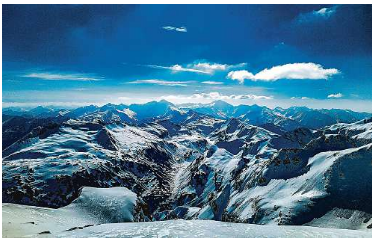
Mölltal je jediný ledovec v Korutanech, který obnovil provoz.