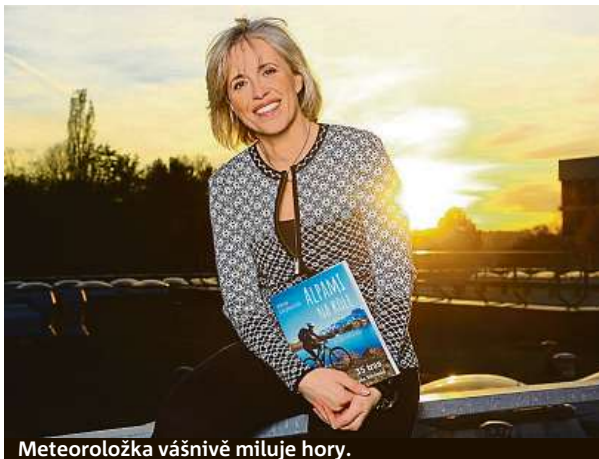
Meteoroložka vášnivě miluje hory.

V rozhlasu jako meteorolog nepracuji, tam si v rámci svého pořadu Zálety povídám s hosty a meteorologie se dotýkáme jen okrajově, někdy vůbec. Záleží na tom, s kým mluvím. V televizi je základem grafika, nikoli osoba meteorologa. Máme možnost ji upravit těsně před vysláním, tedy dávat divákům k dispozici