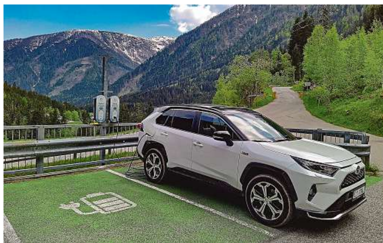
V údolí lze před nástupem do lanovky dobít hybridní auto u stojanů Kelag.