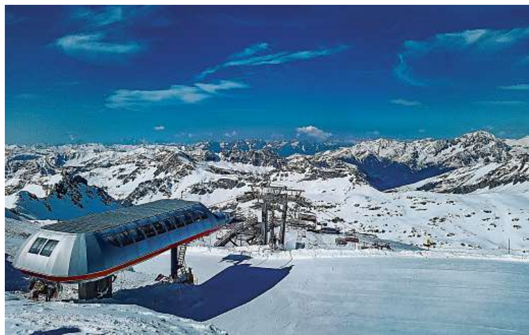
Výhled z horní stanice lanovky na vrcholku Schareck (3122 metrů)