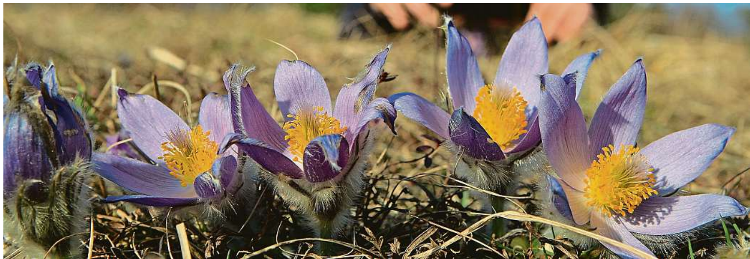
Květy koniklece velkokvětého v brněnské přírodní rezervaci Kamenný vrch