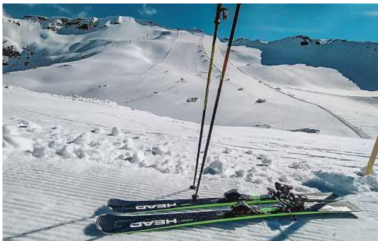
Vlevo červená sjezdovka, vpravo modrá. Je to ale spíš taky červená.