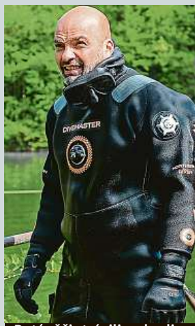
Potápěči strávili 40 hodin pod vodou.

Stavbaři dnes začínají s dostavbou dálnice D4 mezi Příbramí a Pískem. V provozu má být do konce roku 2024. Jde o první projekt výstavby dálnice formou PPP v Česku, stát by měl za využívání nové dálnice zaplatit 17,8 miliardy korun, a to po dobu 24 let. D4 z Prahy na jih Čech se staví od 60. let minulého století. ČTK