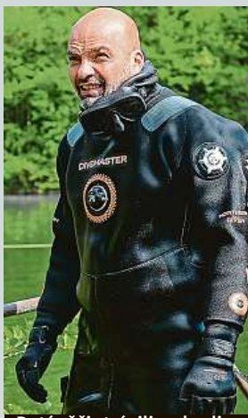
Potápěči strávili 40 hodin pod vodou.

Stavbaři dnes začínají s dostavbou dálnice D4 mezi Příbramí a Pískem. V provozu má být do konce roku 2024. Jde o první projekt výstavby dálnice formou PPP v Česku, stát by měl za využívání nové dálnice zaplatit 17,8 miliardy korun, a to po dobu 24 let. D4 z Prahy na jih Čech se staví od 60. let minulého století. ČTK