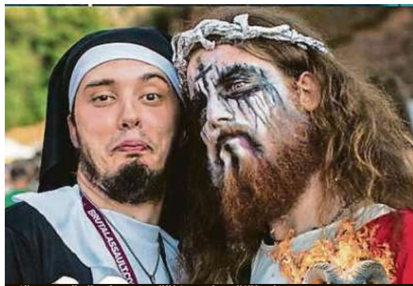
Již 24. ročník akce se těší i na drsnější náтуры. BRUTALASSAULT.CZ