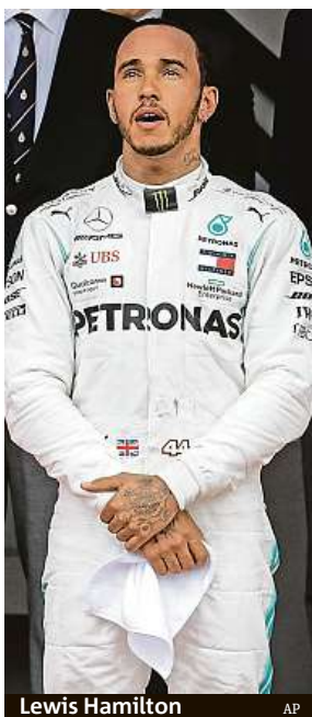
Lewis Hamilton

Hamilton v Kanadě zvítězil v letech 2007, 2010, 2012, 2015, 2016 a 2017. Až loni jeho nadvládu narušil Sebastian Vettel z Ferrari, který rovněž díky druhému místu v Monaku přerušil letošní dominanci Mercedesu. A právě italské stáji by i přes dosavadní trápení měla charakteristi-