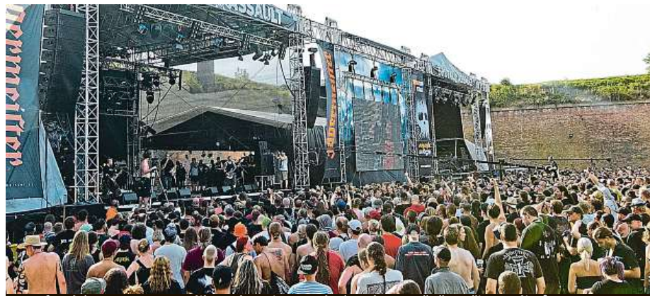
Josefovská pevnost se zrodila na konci 18. století. Jednou ročně patří metalistům.