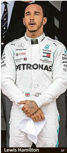
Lewis Hamilton

Hamilton v Kanadě zvítězil v letech 2007, 2010, 2012, 2015, 2016 a 2017. Až loni jeho nadvládu narušil Sebastian Vettel z Ferrari, který rovněž díky druhému místu v Monaku přerušil letošní dominanci Mercedesu. A právě italské stáji by i přes dosavadní trápení měla charakteristi-