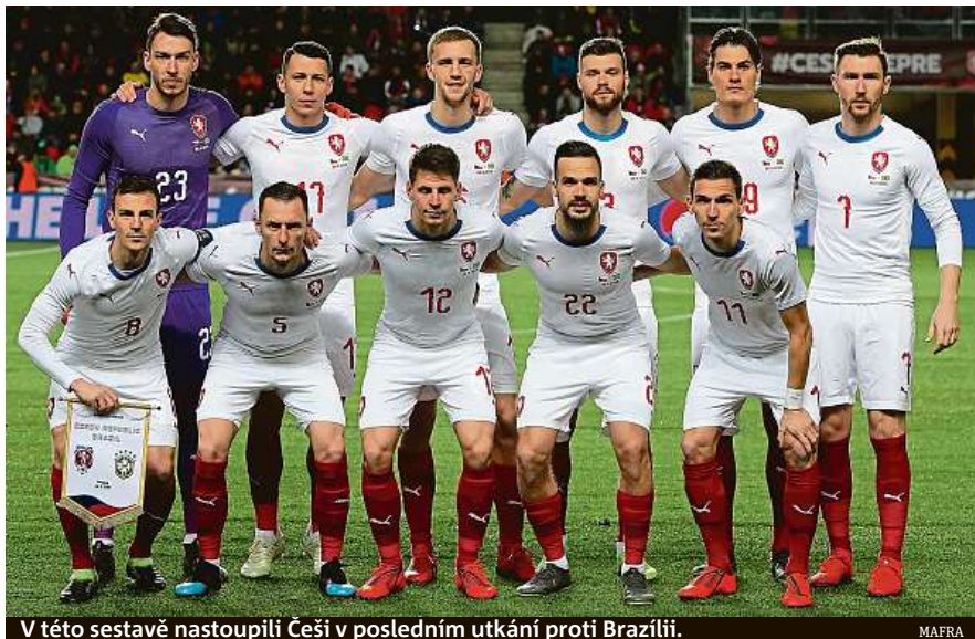
V této sestavě nastoupili Češi v posledním utkání proti Brazílii.