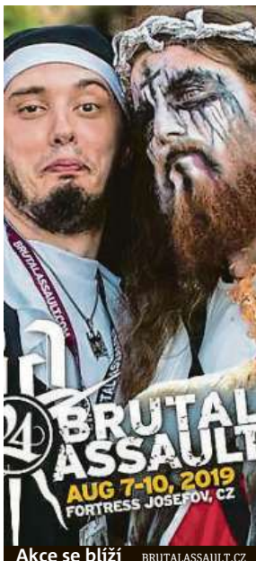
Akce se blíží BRUTALASSAULT.CZ

Festival bude naladěný od středy 7. do soboty 10. srpna. Vábí na pestrý a různorodý line-up s více než 130 interprety, který fanouškům hudby otevírá obzory. „Nezaměřuje se pouze na hudbu, kromě skvělého jídla nabízí neotřelé výstavy nebo moderované rozhovory s osobnostmi scény,“ uvádí za agenturu Obscure promotion Pavel Pavlík a dodává, že obvyklých 20 tisíc návštěvníků láká i kempování za hradbami a samozřejmě hlavní tahák festivalu – hudba. „Zastoupeny jsou žánrové ikony Anathema, Anthrax, Carcass, Deicide, Emperor, Hypocrisy, Meshuggah, Napalm Death, Parkway Drive, Sick of it All, Sodom nebo Therion,“ vyjmenovává Obscure promotion.