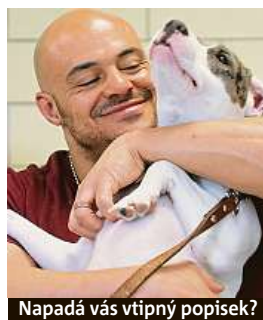
Napadá vás vtipný popisek?

Napište bublinu a reagujte na sloupek na: www.facebook.com/denikmetro