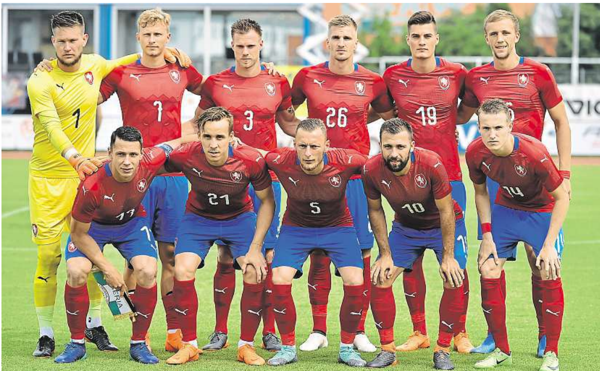
Základní sestava české fotbalové reprezentace před přípravným utkáním proti Nigérii včera v rakouském Schwechatu ČTK