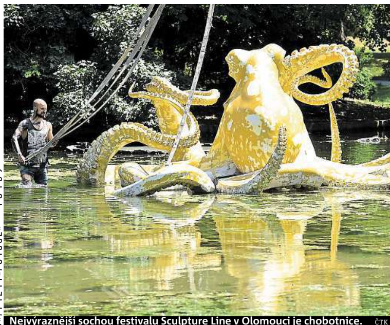
Nejvýraznější sochou festivalu Sculpture Line v Olomouci je chobotnice.