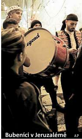
Bubeníci v Jeruzalémě

V jeruzalémském Starém Městě se vyvolávači vydávají do ulic ve dvě hodiny ráno. V postním měsíci ramadánu věřící nejedí za denního světla a najíst a napít se mohou před rozbřeskem a pak až po západu slunce. Letošní ramadán skončí příští týden.