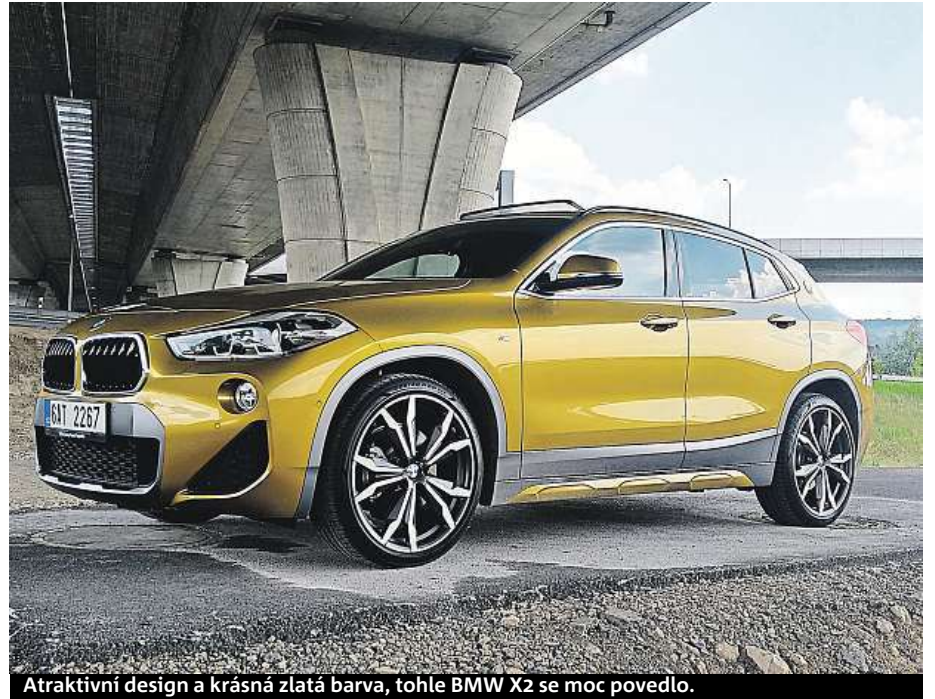
Atraktivní design a krásná zlatá barva, tohle BMW X2 se moc povedlo.