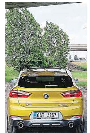
Blíž k vozovce