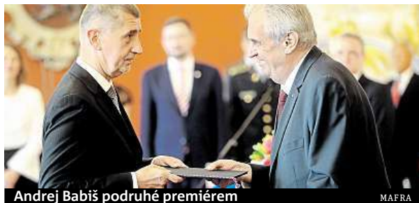
Andrej Babiš podruhé premiérem