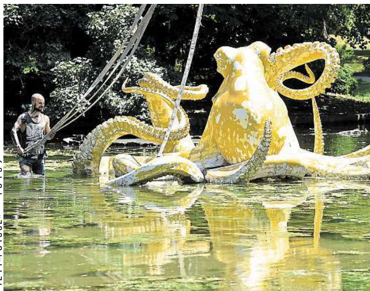
Nejvýraznější sochou festivalu Sculpture Line v Olomouci je chobotnice.

Ministerstvo financí varuje: Účastí na hazardní hře může vzniknout závislost! TB+