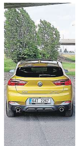
Blíž k vozovce