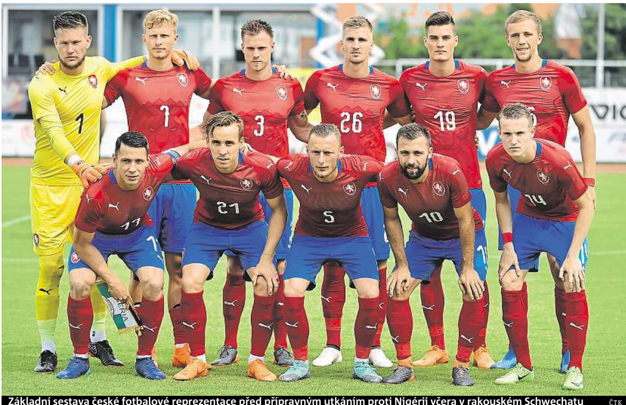
Základní sestava české fotbalové reprezentace před přípravným utkáním proti Nigérii včera v rakouském Schwechatu