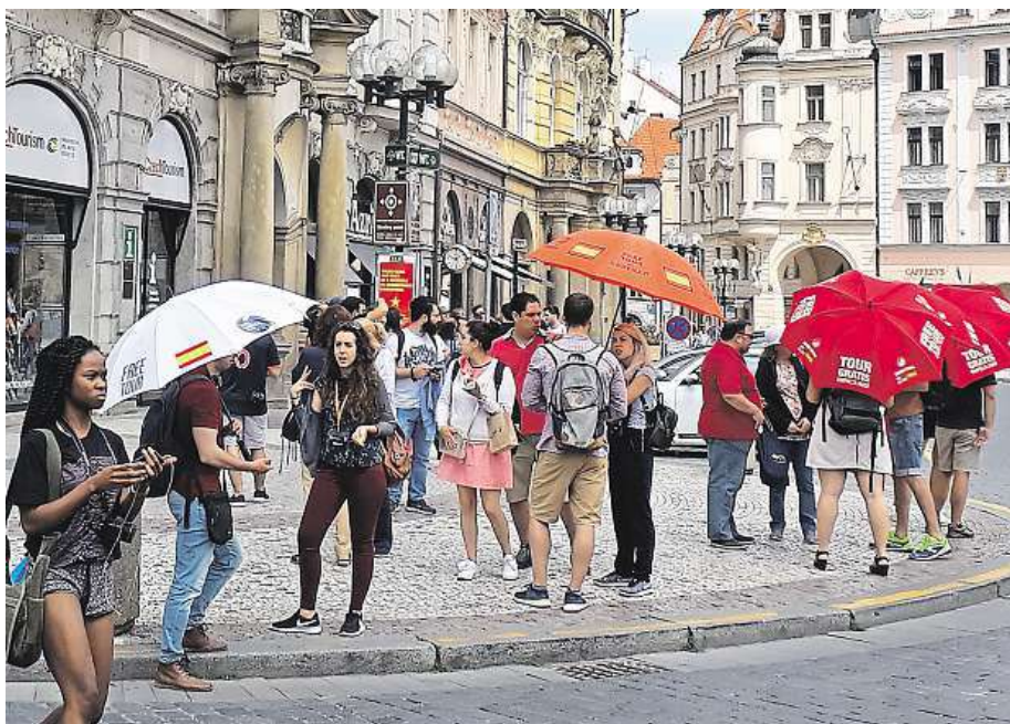
Každý den jsou na Staroměstském náměstí desítky průvodců.

Podle této průvodkyně, jež absolvovala dvouletou přípravu cestovních a poté studovala na Filozofické fakultě Univerzity Karlovy, je problém, že „pohádkáře“ s deštníky skoro nikdo nekontroluje. Za pravdu jí dává i Barbora Hrubá, mluvčí Prague City Tourism. „Příslušný úřad kontroly provádí pouze v minimální míře, spíše výjimečně,“ říká Hrubá. Živnostenský