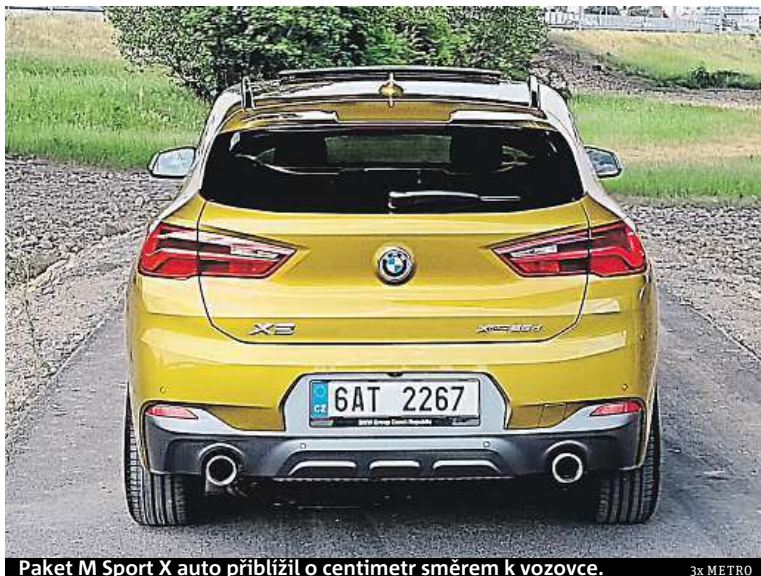
Paket M Sport X auto přiblížil o centimetr směrem k vozovce.