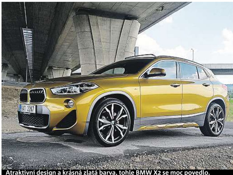
Atraktivní design a krásná zlatá barva, tohle BMW X2 se moc povedlo.