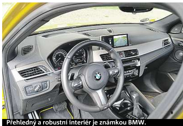
Přehledný a robustní interiér je známkou BMW.

cenovka je trochu vyšší, nejlevnější tříválec vyjde na 850 tisíc, námi testovaný vůz přesáhl milion korun.