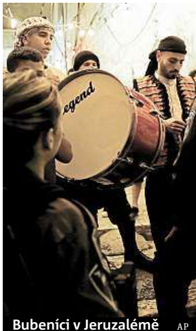
Bubeníci v Jeruzalémě

V jeruzalémském Starém Městě se vyvolávači vydávají do ulic ve dvě hodiny ráno. V postním měsíci ramadánu věřící nejedí za denního světla a najíst a napít se mohou před rozbřeskem a pak až po západu slunce. Letošní ramadán skončí příští týden.