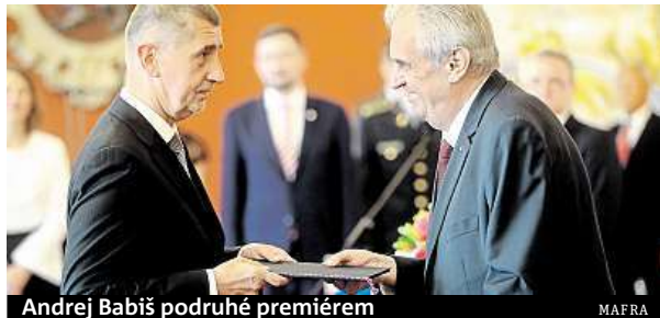
Andrej Babiš podruhé premiérem