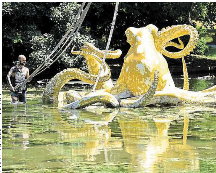
Nejvýraznější sochou festivalu Sculpture Line v Olomouci je chobotnice. ČTK

Ministerstvo financí varuje: Účastí na hazardní hře může vzniknout závislost! TB+