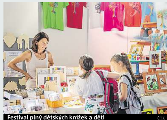
Festival plný dětských knížek a dětí