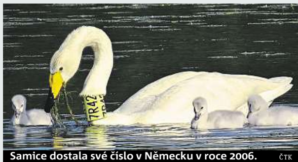
Samice dostala své číslo v Německu v roce 2006. ČTK

u nás. Labutě zpěvné hnízdí na malých jezerech v tundře na severovýchodě Evropy. U nás se občas objevují v době tahu nebo i vzácně zimují. ČTK