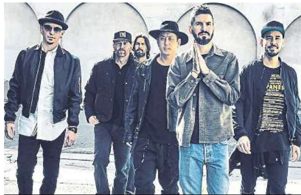
Kapela Linkin Park vystoupí v Praze už v neděli.

Během letošního více než desetihodinového hudebního maratonu se na pódium postaví třeba i oblíbená skupina Simple Plan z Kanady. Vystoupení rapera Machine Gun Kelly alias MGK zaručí, že si na své přijdou i ti, kteří nepřestávají lovit nejlepší hip-hopové zážitky. Dalšími účinkujícími budou energii