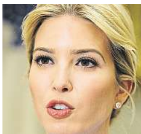
Ivanka Trump

Spojené státy vyzvaly Čínu, aby okamžitě propustila tři aktivisty, kteří zkoumali pracovní podmínky u čínských dodavatelů Ivanky Trump. Na konci května vyšlo najevo, že jeden z členů newyorské nevládní organizace China Labor Watch (CLW) byl uvězněn a další dva se pohřešují. Všichni tři muži jsou podle právního zástupce ve vazbě ve městě Kan-čou na ji-