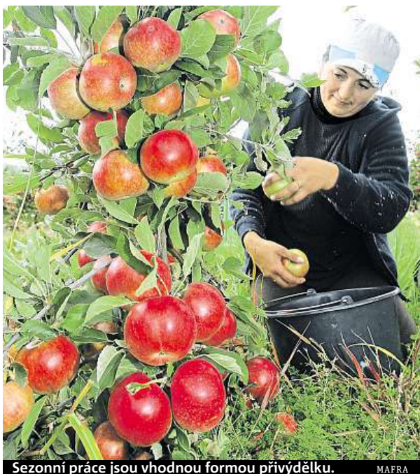
Sezonní práce jsou vhodnou formou přivýdělku.

V tomto případě je vhodná takzvaná dohoda o provedení práce (DPP). Tato forma dohody nesmí překročit 300 hodin v kalendářním roce, nicméně pokud máte uzavřeno více dohod u několika zaměstnavatelů, platí tento limit pro každého zaměstnavatele zvlášť. DPP je zajímavá především pro ty pracovníky, jejichž hrubý měsíční výdělek dosahuje maximálně 10 tisíc korun. V dané chvíli totiž zaměstnanec ani zaměstnavatel neodvádí zdravotní a sociální pojištění, platí se pouze patnáctiprocentní daň.