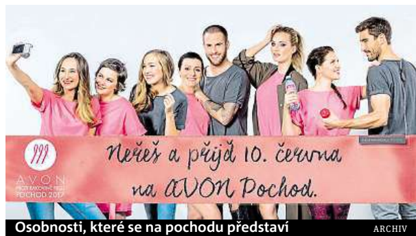
Osobnosti, které se na pochodu představí