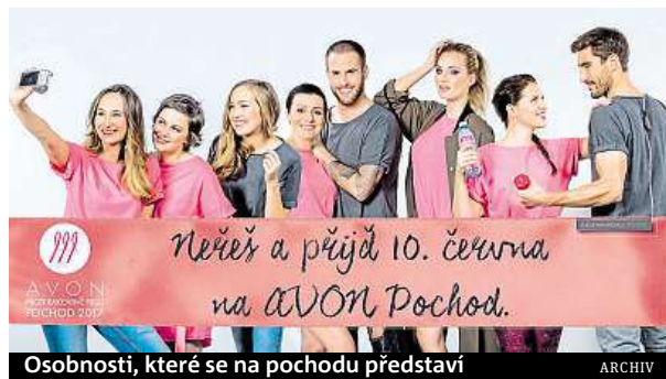
Osobnosti, které se na pochodu představí