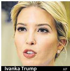
Ivanka Trump

Čína vězní muže, kteří pátrali po výrobě značky Ivanka Trump.