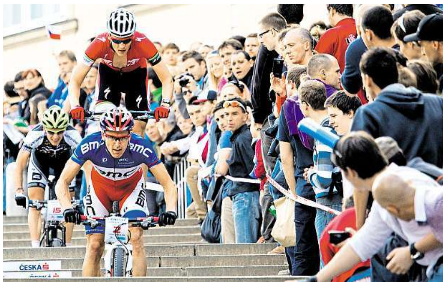
Elita jezdců na horských kolech se utká v závodech Pražské schody.

Stejně jako v předchozích letech dokázali pořadatelé největší bikerské akce v srdci staré Prahy přilákat na start ty nejlepší z nejlepších jak