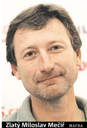
Zlatý Miloslav Mečíř

Mezinárodní olympijský výbor chystá vlastní televizní stanici. Na jejím vzniku se dohodl s 27 mezinárodními sportovními federacemi. „Termín spuštění kanálu oznámíme v příštích týdnech,“ řekl předseda MOV Thomas Bach. ČTK