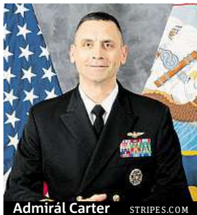
Admirál Carter STRIPES.COM

Japonská policie v současné době řeší i další případ, do kterého jsou zapleteni Američané. Civilista, který na základně pracoval, byl totiž obviněn