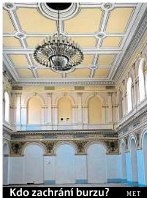
Kdo zachrání burzu? MET

Více štěstí má pavilon číslo 40. Mohly by tu fungovat takzvané start-upy. Budovu by chtěli opravit a provozovat lidé organizující Signal Festival. „Chceme tu vybudovat kreativní centrum, které by