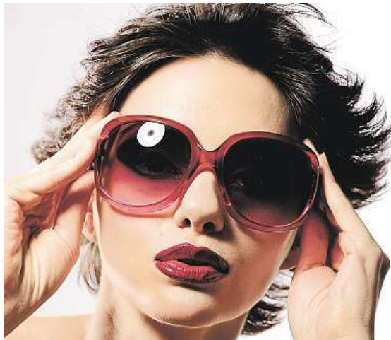
Nezapomeňte chránit oči své i dětí.

Dětské sluneční brýle jsou vyráběny v různých velikostech, jak ale poznat tu správnou? „Bez vyzkoušení je to takřka nemožné. Rodičům určitě nedoporučuji kupovat brýle na internetu. Důležité je, aby brýle netlačily po stranách ani za uchem a hezky seděly na nose. Brýle by měly