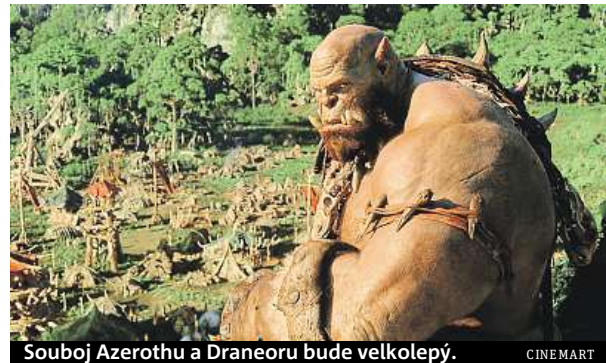
Souboj Azerothu a Draneoru bude velkolepý.

pracované charaktery. „Máme hrdiny, s nimiž se na dobrodružnou výpravu každý rád vydá. Jsem rád, že je film plný dokonalých trikových efektů,