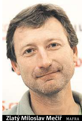
Zlatý Miloslav Mečíř MAFRA

Zatímco ve dvouhřích bude hrát 64 hráčů, pavouky čtyřher tvoří jen 32 párů a nejbližší k medaili je ve smíšené čtyřhře, ve které bude jen 16 párů. ČTK