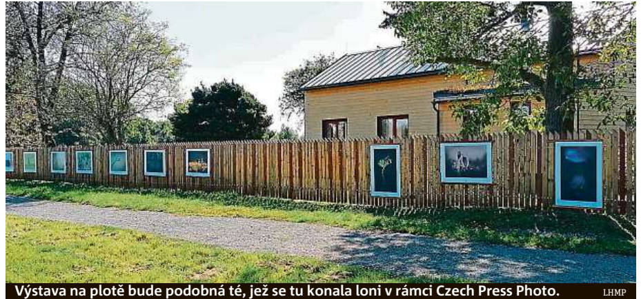
Výstava na plotě bude podobná té, jež se tu konala loni v rámci Czech Press Photo. LHMP

Soutěž v pozorování rostlin či zvířat má dohru v ekocentru Prales.