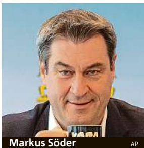
Markus Söder

„Nebudete potřebovat testy a vztahovat se na vás nebude ani karanténa či omezení nočního vycházení.“ Tak se k proočkováným a uzdraveným bavorským spoluobčanům vyjádřil bavorský premiér Markus Söder. Hlava spolkové země si přitom neodpustila poznámku, že Mnichov je o krok před německou vládou. Ta podobné rozvolnění pravidel teprve připravuje, platit by v případě souhlasu zákonodárců mohlo od víkendu. „Bavorsko navíc od příštího pondělí v okresech s přízni-