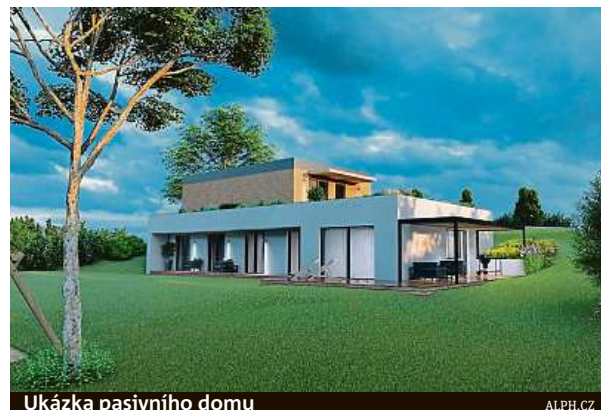
Ukázka pasivního domu

Chystá další videovorbou. „Mnoho lidí se nás ptá, jak to vypadá vevnitř domu. Chystáme proto komentovanou prohlídku po celém domě