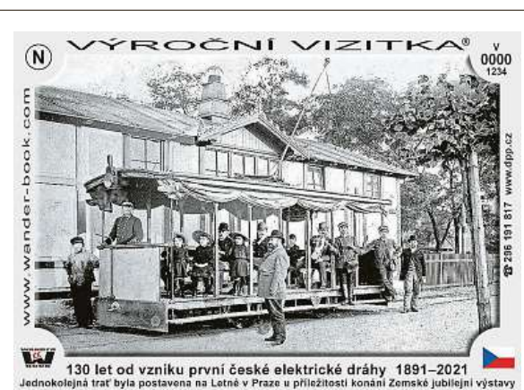
130 let od vzniku první české elektrické dráhy 1891–2021 Jednokolejná trať byla postavena na Letné v Praze u příležitosti konání Zemské jubilejní výstavy

Zpět k lidem se dostalo už 1820 předmětů. Největší zájem byl o vybavení do domácnosti – nádobí, lůžkoviny či drobný nábytek. Lidé do center odkládali i knihy a objevovaly se zde i sezonní předměty, na jaře tedy re-use centra měla a stále mají množství nářadí pro práci na zahradě.