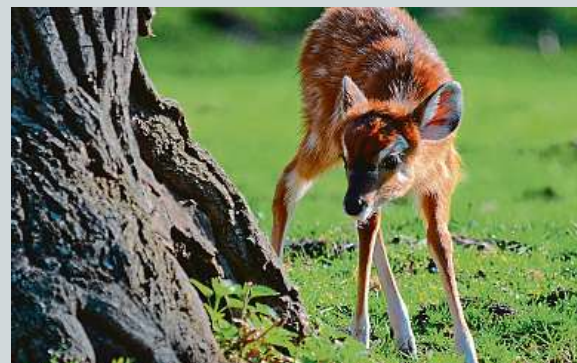
České zoo se otvírají po čtyřech měsících. ZOO HODONÍN