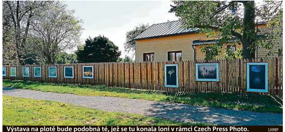
Výstava na plotě bude podobná té, jež se tu konala loni v rámci Czech Press Photo. LHMP

Soutěž v pozorování rostlin či zvířat má dohru v ekocentru Prales.