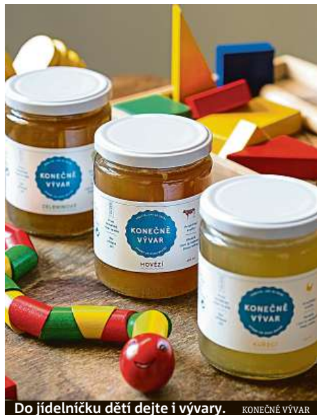
Do jídelníčku dětí dejte i vývary. KONEČNĚ VÝVAR