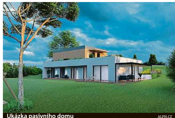
Ukázka pasivního domu

Chystá další videovorbou. „Mnoho lidí se nás ptá, jak to vypadá vevnitř domu. Chystáme proto komentovanou prohlídku po celém domě