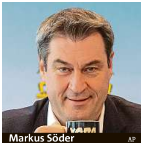
Markus Söder

„Nebudete potřebovat testy a vztahovat se na vás nebude ani karanténa či omezení nočního vycházení.“ Tak se k proočkováným a uzdraveným bavorským spoluobčanům vyjádřil bavorský premiér Markus Söder. Hlava spolkové země si přitom neodpustila poznámku, že Mnichov je o krok před německou vládou. Ta podobné rozvolnění pravidel teprve připravuje, platit by v případě souhlasu zákonodárců mohlo od víkendu. „Bavorsko navíc od příštího pondělí v okresech s přízni-