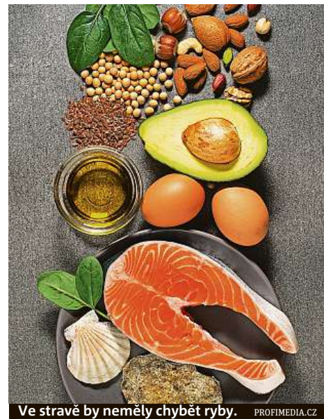
Ve stravě by neměly chybět ryby.