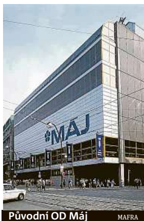
Původní OD Máj

Tyto otázky řeší autorský zákon. Ten stavbu považuje za trojrozměrnou rozmnoženinu autorského díla a má pro ni zvláštní režim. Autorské dílo je dokumentace, podle které je stavba postavena. Aby se ale jednalo o autorské dílo, musí být návrh stavby do určité míry originální. Ne nutně je tedy každá stavba autorským dílem.