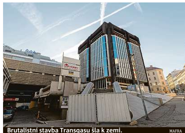
Brutalistní stavba Transgasu šla k zemi.

Ano, o osvětlení na Horním náměstí v Olomouci. Město v roce 2014 vyměnilo lampy, které autor projektu, Jan Šépka, původně v rámci rekonstrukce navrhl. Podle architektka tato výměna poškodila jeho autorské dílo, v čemž mu dal následně za pravdu krajský soud. Dřív než kauza skončila rozhodnutím vrchního soudu, došlo k dohodě stran. Takto dopadne většina podobných soud-