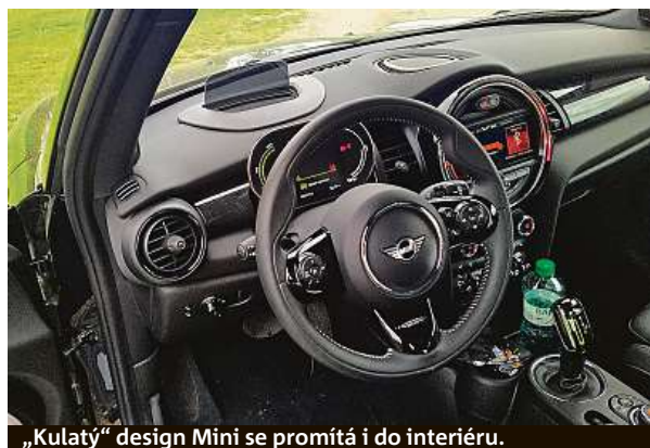
„Kulatý“ design Mini se promítá i do interiéru.