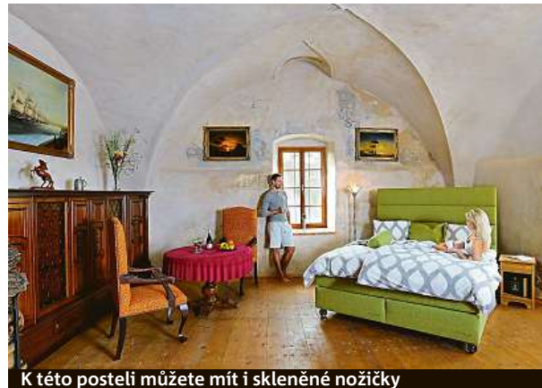
K této posteli můžete mít i skleněné nožičky

Kompletní výroba matrací probíhá v našem závodě v Roztokách u Jilemnice v Krkonoších. Jedná se o bývalou textilní továrnu s historií již od roku 1907. Pro výrobu nakupujeme pouze osvědčené a certifikované materiály od evropských výrobců, převážně z Belgie, Švýcarska a Rakouska a samozřejmě i z Česka. Naše postele Spirit Continental lze vybavit kovanými prvky a nožičkami od kovář-