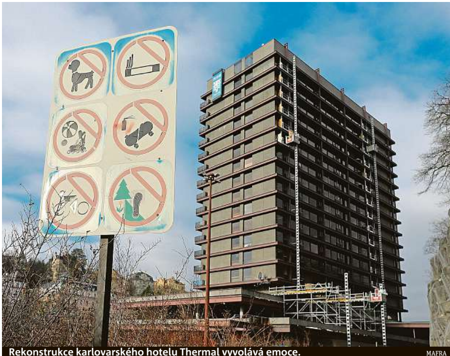
Rekonstrukce karlovarského hotelu Thermal vyvolává emoce.

Znamená to, že úpravy na takové stavbě může vlast-