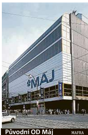
Původní OD Máj

Tyto otázky řeší autorský zákon. Ten stavbu považuje za trojrozměrnou rozmnoženinu autorského díla a má pro ni zvláštní režim. Autorské dílo je dokumentace, podle které je stavba postavena. Aby se ale jednalo o autorské dílo, musí být návrh stavby do určité míry originální. Ne nutně je tedy každá stavba autorským dílem.