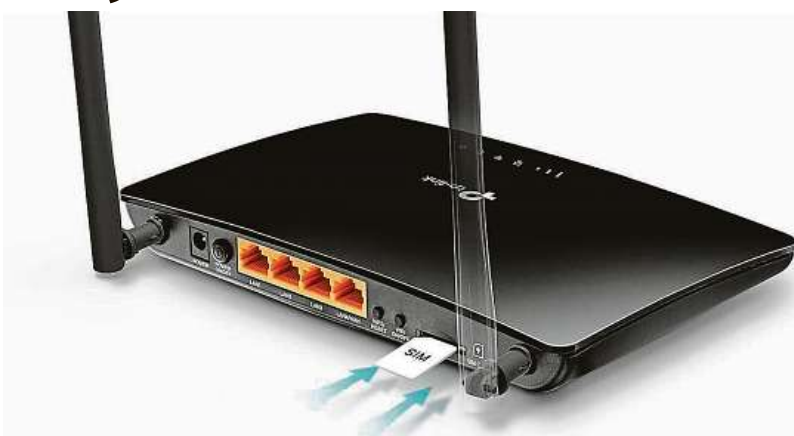
Jednoduché řešení, stabilní přenos

Stabilní a rychlé připojení k internetu vždy po ruce? Spousta z nás už si na to určitě zvykla. V telefonech nám běhá bleskové 4G a domácí internet s úctyhodnou rychlostí už lze pořídit i bez hypotéky. Trnem v oku líbivé budoucnosti s kvalitním internetem na každém kroku jsou přenosné počítače a také místa, kde není možné zavést kabelové připojení. Co s tím? Řešení je možná jednodušší, než byste čekali.