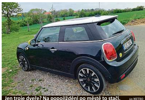
Jen troje dveře? Na popojždění po městě to stačí.

Tak pokud takhle vypadá elektromobilita, bude to v pohodě. Kapesní raketu nabijete doma za tři hodiny.