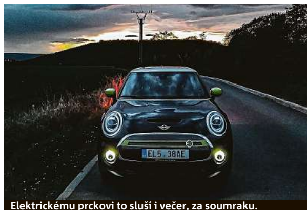
Elektrickému prčkovi to sluší i večer, za soumraku.