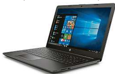
Zajímavý model od HP

A o jakém stroji že je řeč? Jedná se o 250 G7 ze stáje HP. Jeho hlavní chloubou je 15,6" displej s Full HD rozlišením, který vám poskytne dostatek prostoru pro všechny vaše úko-