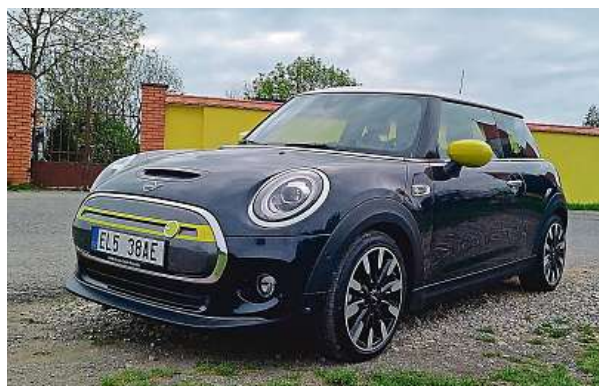
„Elektrická“ espézetka nahrazuje dálniční známku.