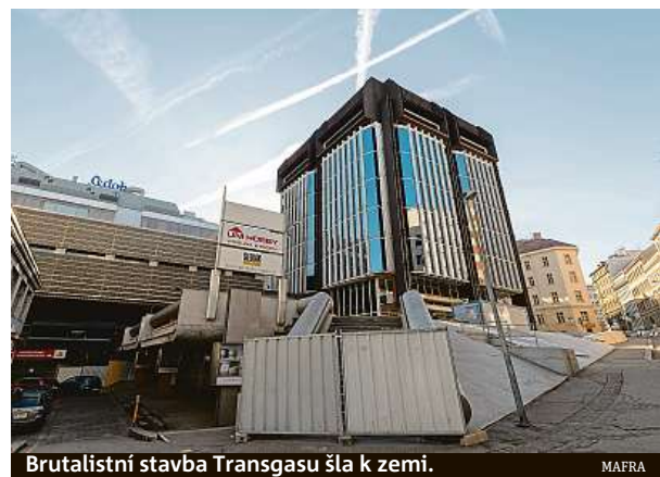
Brutalistní stavba Transgasu šla k zemi.

Ano, o osvětlení na Horním náměstí v Olomouci. Město v roce 2014 vyměnilo lampy, které autor projektu, Jan Šépka, původně v rámci rekonstrukce navrhl. Podle architektka tato výměna poškodila jeho autorské dílo, v čemž mu dal následně za pravdu krajský soud. Dřív než kauza skončila rozhodnutím vrchního soudu, došlo k dohodě stran. Takto dopadne většina podobných soud-