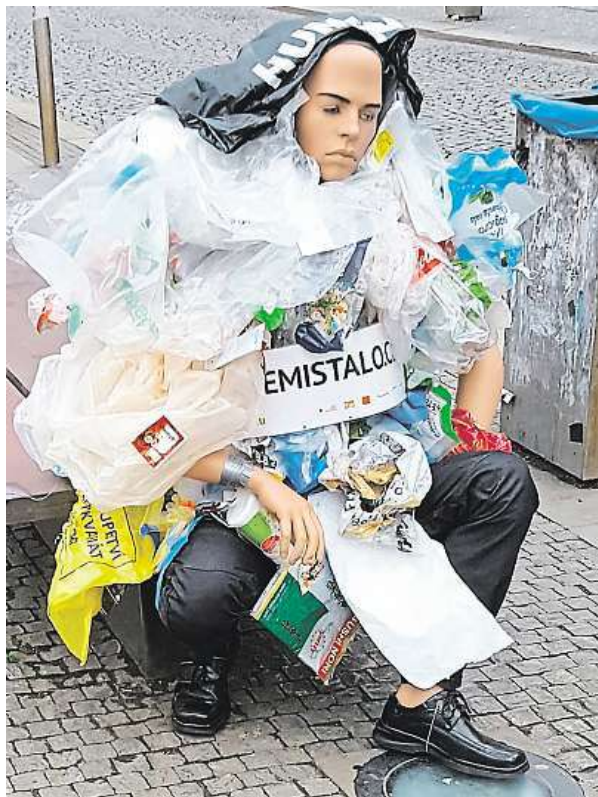
Nešťastník sedí v Praze na Andělu.

líky a dalším haraburdím. Na lavičce tramvajové zastávky Anděl v Praze 5 se včera objevila také odpadem zavalená socha, za kterou se kolemjdoucí otáčejí jako diví. „Reklama na více značek? Takové překvapení hned po ránu. Až jsem se lekla,“ reagovala na neobvyklou figurínu s nápisem Cosemistalo.cz čtenářka deníku Metro Nikola Selecká. FILIP JAROŠEVSKÝ