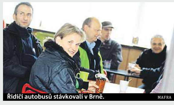
Řidiči autobusů stávkovali v Brně.

Prezident Miloš Zeman na své návštěvě středočeského kraje v Úhličkách řekl, že kardinál Miloslav Vlk porušil slova svého předchůdce kardinála Františka Tomáška, že restituce skončily rokem 1991 a církev už žádný další majetek nebude požadovat. Zeman tak vysvětloval svou neúčast na pohřbu Vlka, který byl zastáncem církevních restitucí. Pražské arcibiskupství se ohradilo. Nic takového prý Tomášek netvrdil a Zeman lže.