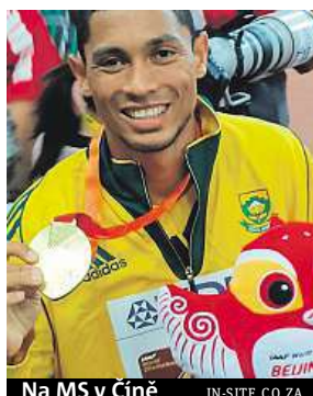
Na MS v Číně

Čtyřiatdvacetiletý Van Niekerk v olympijském finále v Rio z osmé dráhy předčil všechny soupeře a časem 43,03 vylepšil o 15 setin sekundy světový rekord Američana Michaela Johnsona. Na Zlaté tretře startoval již v roce 2013, kdy jako nadějný atlet doběhl na čtvrtce druhý za olympijským vítězem z Londýna Kirani Jamesem z Grenady. Tentokrát si vyzkouší o sto metrů kratší trať. Loni v Kingstonu na ní časem 31,03 překonal africký rekord. „Považuji třístovku za skvělou disciplínu pro posouzení formy v náročné sezoně. Zároveň získám informaci, kde se nacházím v souvislosti s možnými výkony na 200 a 400 metrů. Očekávám skvělý běh a je