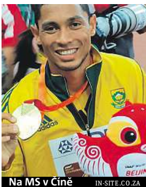
Na MS v Číně IN-SITE.CO.ZA

Atletický mítink Zlatá tretra hlásí účast další hvězdy.