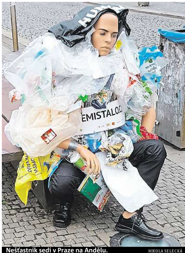
Nešťastník sedí v Praze na Andělu.

líky a dalším haraburdím. Na lavičce tramvajové zastávky Anděl v Praze 5 se včera objevila také odpadem zavalená socha, za kterou se kolemjdoucí otáčejí jako diví. „Reklama na více značek? Takové překvapení hned po ránu. Až jsem se lekla,“ reagovala na neobvyklou figurínu s nápisem Cosemistalo.cz čtenářka deníku Metro Nikola Selecká. FILIP JAROŠEVSKÝ