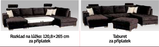
Rozklad na lůžko: 120,8×265 cm za příplatek