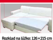
Rozklad na lůžko: 126×215 cm

21 990,- Sleva 54% 9 999,- ROHOVÁ SEDACÍ SOUPRAVA