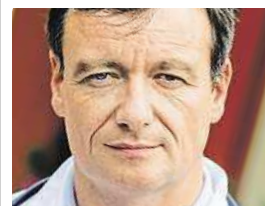
Ve vazbě neutrácel

Rath dostával po celou dobu strávenou ve vazbě plat poslance v plné výši. Sněmovna mu také hradila výdaje na odborné a administrativní práce, na asistenta, telefon a internet a také příspěvek na kancelářský materiál včetně nájemného za regionální kancelář poslance v jeho volebním kraji. MAP, ČTK