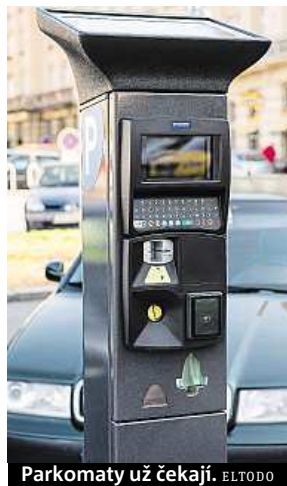
Parkomaty už čekají. ELTODO

kteř z dalších etap. Radnice Prahy 6 a 9 chtějí, aby tam nevznikly původně plánované návštěvnické zóny, ale smíšené zóny, které budou sloužit rezidentům i návštěvníkům zároveň. Od zavedení parkovacích zón zcela upustila rad-