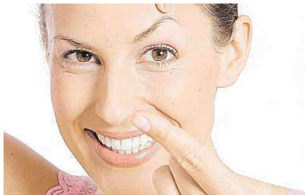
Asi největší český vynález – kontaktní čočka

Jeho vynález tehdejšímu Československu vynášel velké peníze z licenčních poplatků. Akademie věd po roce 1968, kdy upadl v nemilost,