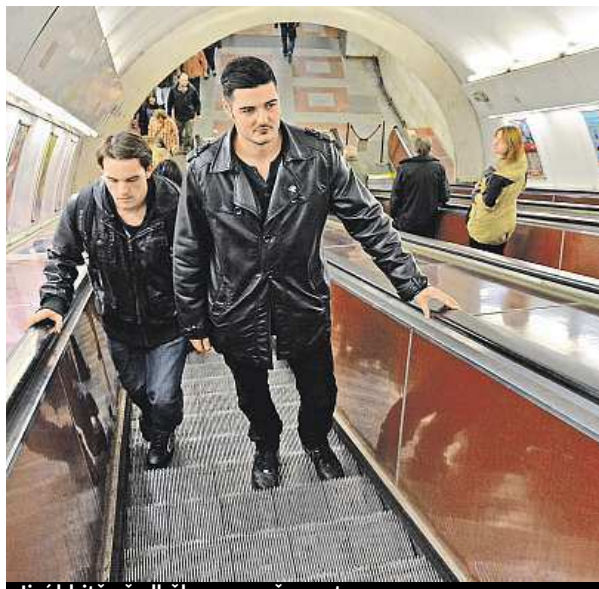
Jiní hbitě předběhnou opačnou stranou.