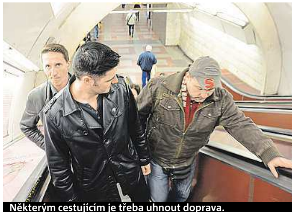
Některým cestujícím je třeba uhnout doprava.