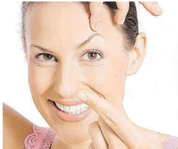
Asi největší český vynález – kontaktní čočka

Patenty mohou Česku vydělat obrovské peníze. Důkazem mohou být objevy již zesnulého českého chemika Antonína Holého. Ten v 90. letech objevil látku, která pomáhá léčit AIDS a žloutenku typu B. Pražský Ústav organické chemie a biochemie díky němu ročně vydělává miliardy korun. MAREK HÝŘ