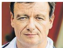
Ve vazbě neutrácel

Rath dostával po celou dobu strávenou ve vazbě plat poslance v plné výši. Sněmovna mu také hradila výdaje na odborné a administrativní práce, na asistenta, telefon a internet a také příspěvek na kancelářský materiál včetně nájemného za regionální kancelář poslance v jeho volebním kraji. MAP, ČTK