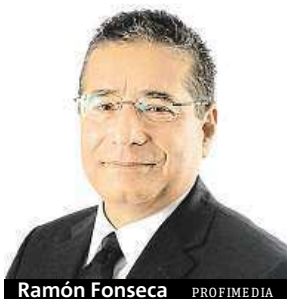
Ramón Fonseca

Jeden ze zakladatelů panamské právní firmy Ramón Fonseca Mora včera prohlásil, že za zveřejněním informací o financích v daňových rájích je útok hackerů. Firma už podala trestní oznámení. Fonseca se také nelíbí, jak byla Mezinárodním sdružením investigativních novinářů zveřejněna část firemní elektronické komunikace. Je podle něho „vytržená z kontextu“ a „mylně interpretovaná“. Mezi nově zveřejněnými informacemi je, že přední severokorejská firma využívá k financování jaderného zbrojního programu