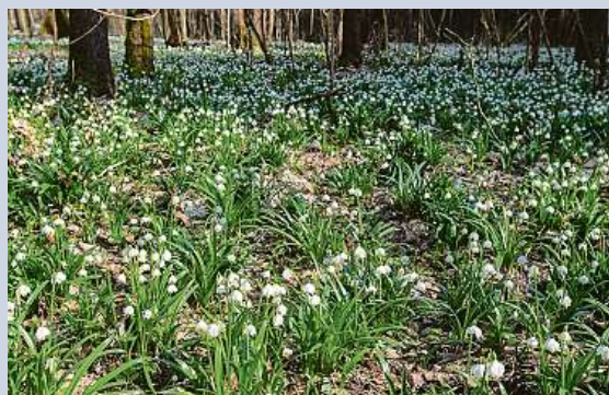
V Údolí Sejfů kvetou bledule, o měsíc dřív než obvykle.

V Údolí Sejfů nedaleko Ústí nad Orlicí kvetou bledule, o měsíc dřív než obvykle. Údolí je registrováno jako významný krajinný prvek a vede jím naučná stezka. Meteorologové před několika dny přišli se zprávou, že letošní únor byl nejteplejším únorem na území ČR od roku 1961. Byl dokonce teplejší než většina březnů. Průměrná teplota dosáhla 5,7 stupně