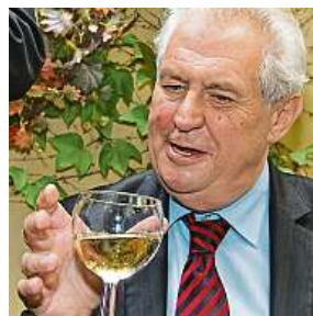
Miloš Zeman se nikdy nestal tvářím Suchého února.

Letošních 29 dnů bez alkoholu si vyzkoušelo nevídaných 17 procent dospělých, v přepočtu to je asi 1,2 milionu lidí. Vysoká účast odráží rostoucí povědomí a snahu o změnu v přístupu k alkoholu. Ale ani dvanáctý ročník Suchého února (na Slovensku Suchý február) zřejmě razantně nesníží konzumaci alkoholických nápojů v obou souse-