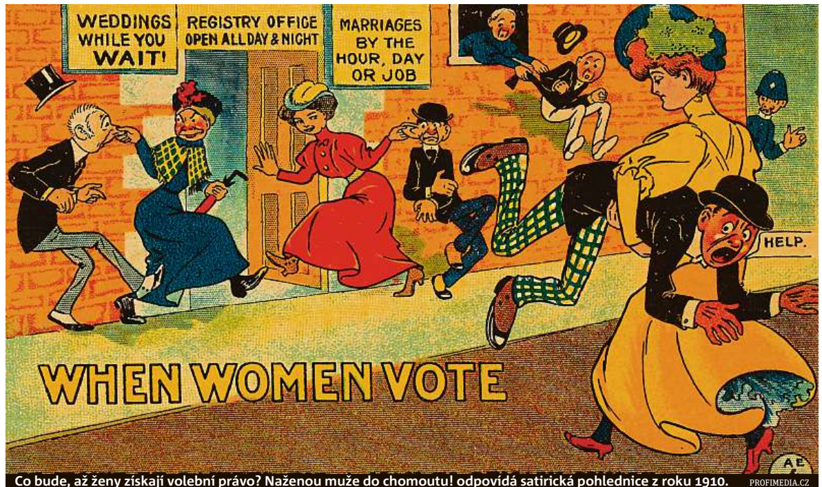
Co bude, až ženy získají volební právo? Naženou muže do chomoutu! odpovídá satirická pohlednice z roku 1910.

K tomu došlo devět let po newyorské stávce. A opět to bylo ve spojení se ženami. Ve čtvrtek 8. března 1917 totiž vyšly do ulic ženy v ruském Petrohradu s požadavky „chleba a míru“ – tedy s požadavky na ukončení války a zlepšení zásobování, proti zkracování potravinových přidělů. Požadovaly však také ukončení samoděržaví. Byly podpořeny desetitisíci