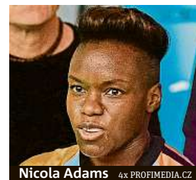
Nicola Adams