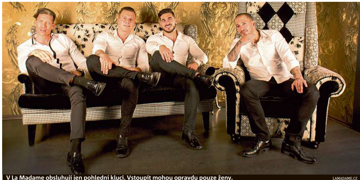
V La Madame obsluhují jen pohlední kluci. Vstoupit mohou opravdu pouze ženy.