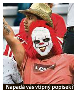
Napadá vás vtipný popisek?

Napište bublinu a reagujte na sloupek na: www.facebook.com/denikmetro