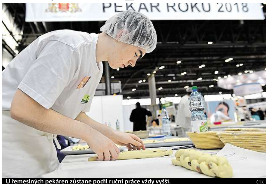
U řemeslných pekáren zůstane podíl ruční práce vždy vyšší.

„Pokud mají dobrý marketing a dobré inovační výrobky v dobré kvalitě, tak na to