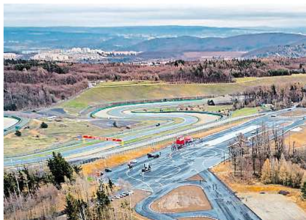
Zbrusu nový brněnský polygon

Aby mohl zájemce kurz absolvovat a zažádat si o odpočet bodů, musí splňovat tři hlavní podmínky. „V první řadě nesmí mít na kontě více než deset trestných bodů. Zároveň žádné trestné body nemohou být za vážné dopravní přestupky, které jsou ze zá-