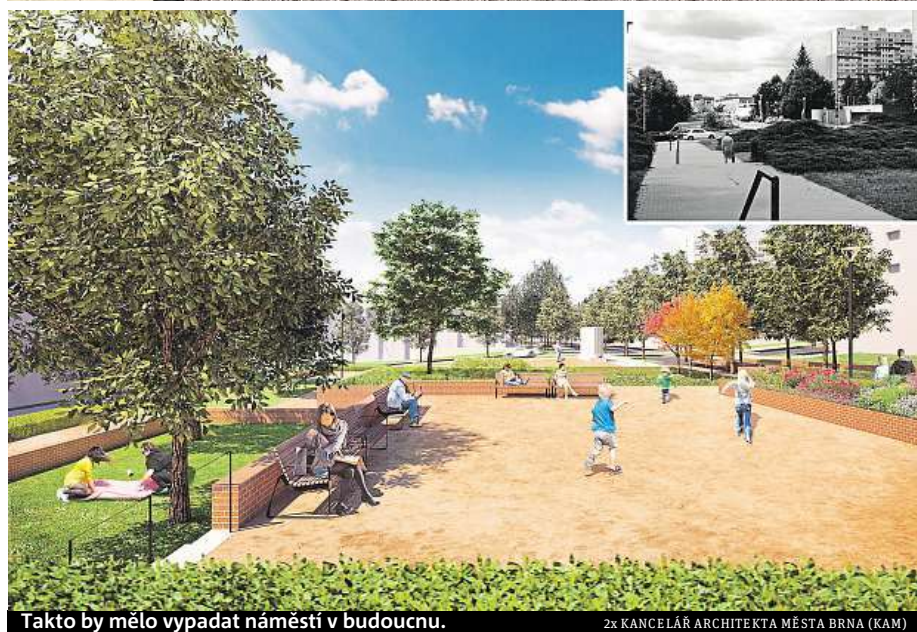
Takto by mělo vypadat náměstí v budoucnu.