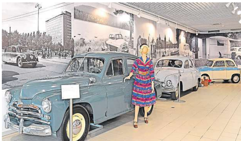
V popředí vůz Poběda sovětské provenience

V době, jíž se výstava zabývá, vznikaly stejně jako dnes zajímavé, celosvětově ojedinělé prototypy aut, které se však nedočkaly své realizace. V sekci „Zašlapané automobilové projekty“ návštěvníci uvidí například první československý elektromobil EMA, který vznikl ve Výzkumném ústavu elektrických strojů točivých v Brně ve spolupráci s katedrou spalovacích motorů brněnského Vysokého učení technického. Elektromobil je unikátní v tom, že jeho konstruktéři nechtěli elektrifikovat žádné už existující auto, ale vytvořili vlastní model. Měl to být malý městský vůz pro dva dospělé a dvě děti, který na jedno nabití ujel padesát kilometrů. Vůz EMA na mezinárodní výstavě