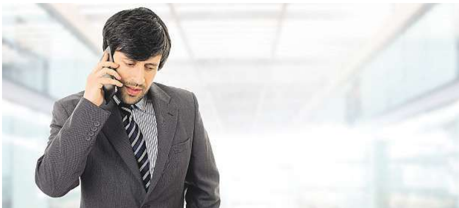
Podnikatelů na jihu Moravy mírně přibýlo.

Více než 40 procent všech podnikatelů a podniků v Jihomoravském kraji sídlí v Brně.