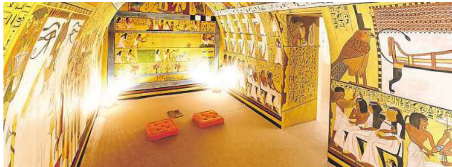
Muzeum v rakouském Mistelbachu přináší atributy starověkého Egypta.

Výstavou Úchvatné pyramidy se muzeum MAMUZ v Mistelbachu věnuje těmto impozantním monumentům a otvírá pohled do světa starověkého Egypta s jeho kultury, rituály a posmrtným životem. „Jedním z vrcholů výstavy je rekonstruovaná Sennedjemova pohřební komora. Fresky na jejích stěnách zobrazují scény z každodenního života a obrazy ze světa egyptských bohů. Zobrazení bohyně Isis a její sestry Neftys dokazují, že Egyptané při budování hro-