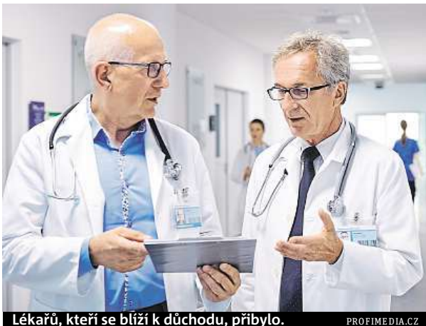
Lékařů, kteří se blíží k důchodu, přibývá.

„Pokud se nic nezmění, bude v roce 2025 třetina veškeré kapacity krytá lékaři ve