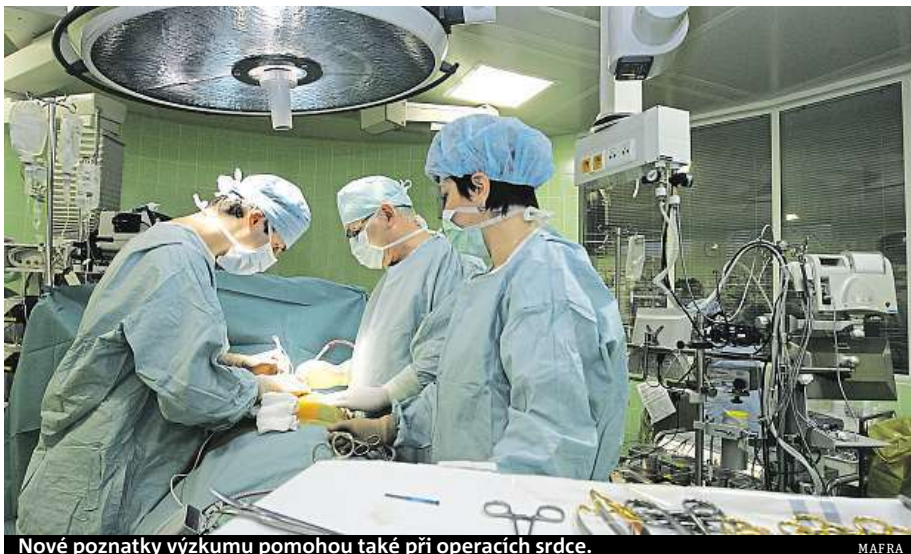
Nové poznatky výzkumu pomohou také při operacích srdce.

Provoz 25 týmů stál ročně necelých 300 milionů korun,