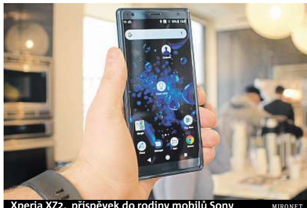
Xperia XZ2, příspěvek do rodiny mobilů Sony

Leckoho možná překvapí poměrně výrazná změna designu, kdy dříve ostré hrany nahradily elegantně zaoblené křivky. Větší z obou novi-