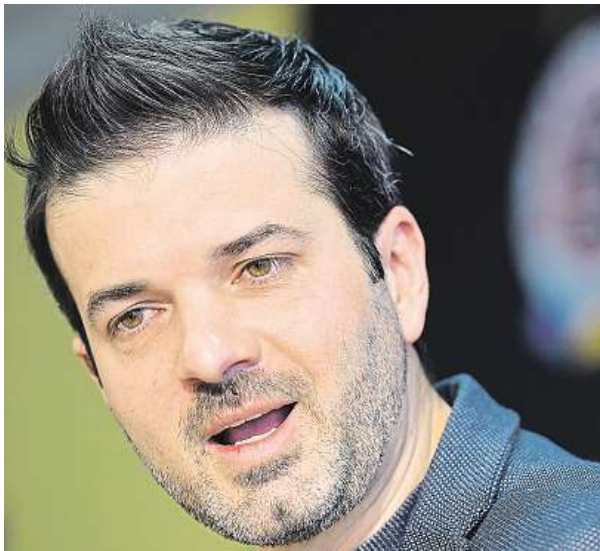
281 dnů a dost. Andrea Stramaccioni na Letné skončil.

Stramaccioni přišel do Sparty loni v květnu, kdy podepsal dvouletý kontrakt. V rámci přebudování kádru přivedl řadu zahraničních a rekordně drahých posil. V zimě se situace opakovala, když za 117 milionů korun přišel Nicolae Stancu z Anderlechtu. Spartu jeho působení na platy a nákladech na posily vyšlo odhadem téměř na půl miliardy korun.