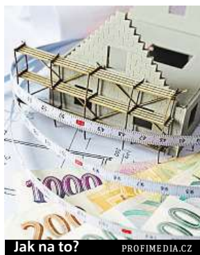
Jak na to?

Banka: devadesát procent je maximum – Česká národní banka přitvrzuje v doporučených pro banky, a to především u maximální výše hypoték, takzvané LTV. Nejdříve doporučila poskytovat úvěry maximálně do 96 % LTV a od dubna šla ještě níže, a to na 90 % LTV. Navíc si banky musí velmi pečlivě hlídat i hypotéky nad 80 % LTV. Ve svém portfoliu může mít totiž jen 15 % hypoték s 80 až 90 % LTV. Byť