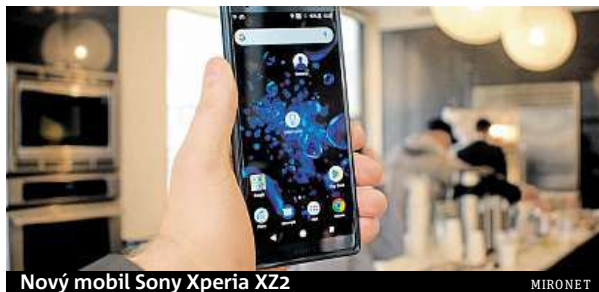
Nový mobil Sony Xperia XZ2

Kromě velikosti displeje (5,7 vs. 5 palců) se od sebe oba modely prakticky neliší. Sony tak nadále zůstává jediným výrobcem, který i do zmenšených verzí svých top modelů pumpuje to nejlepší, co je aktuálně k dispozici. V obou případech se proto