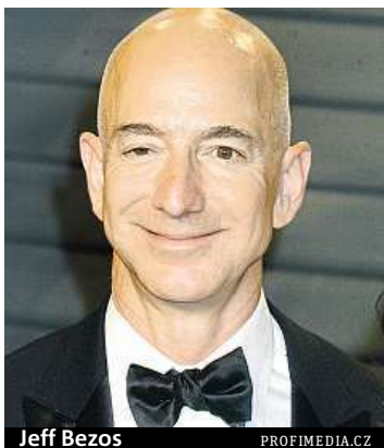
Jeff Bezos

Časopis Forbes zveřejnil žebříček nejmovitějších lidí na světě.