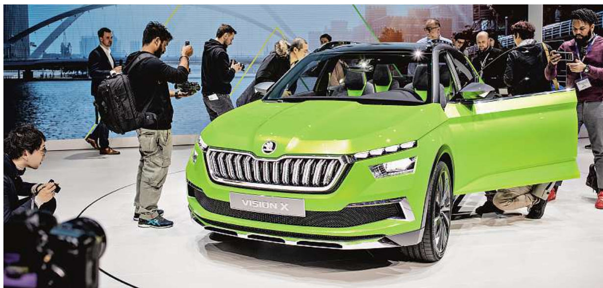
Skoda Auto představila na autosalonu v Ženevě koncept nového městského SUV Vision X. Na trhu bude v roce 2019.

Na směny. Mimo přirozené biorytmy pracuje zhruba čtvrtina lidí. Poruchy spánku. Nezpůsobují jenom únavu, mohou urychlit některé nemoci. Tloustneme. Příčinou může být také nekvalitní spánek STRANA 2