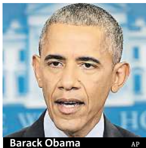
Barack Obama

Šéf FBI James Comey požádal americké ministerstvo spravedlnosti, aby veřejně popřelo tvrzení prezidenta Donalda Trumpa o údajných odposleších. S odvoláním na vysoké americké činitele o tom informoval deník The New York Times. Trump v sobotu obvinil svého předchůdce v úřadu, Baracka Obamu, že ho během loňské předvolební kampaně dal v kanceláři v Trump Tower odposlouchávat.