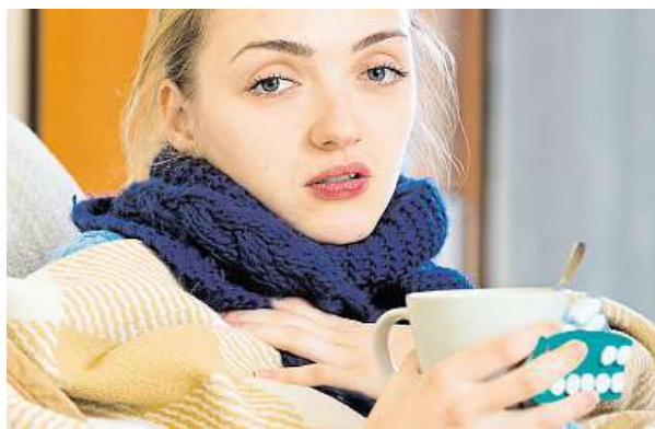
Angína se musí léčit antibiotiky.

Velmi často si také lidé pletoou chřipku a nachlazení. Ani to není jedno a totéž. Klasickou chřipku způsobují specifické viry a může mít mnohem dramatičtější průběh. A také je daleko nebezpečnější, co se týče přidružených komplikací, a „umí“ i zabít. Zatímco nachlazení způsobuje dohromady asi 200 odlišných druhů virů a radí se mezi nejběžnější onemocnění, chřipku přenáší každý rok jen několik různých virů. Ty se primárně dělí na tři typy – A, B a C. „Nejnebezpečnější je typ A, který dokáže nejvýrazněji mutovat a ve vzduchu se tak může nacházet několik jeho