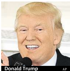
Donald Trump

Prezident Trump nařkl na Twitteru Obamu z odposlechů. Kauzu řeší nejvyšší úředníci.