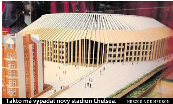
Takto má vypadat nový stadion Chelsea. HERZOG A DE MEURON

Nový stánek fotbalistů Chelsea bude mít kapacitu 60 tisíc fanoušků.