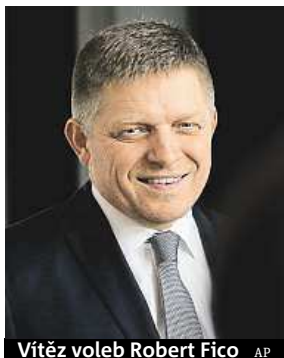
Vítěz voleb Robert Fico

Premiér odmítl, že by jeho strana spolupracovala s krajně pravicovou Lidovou stranou Naše Slovensko (LS NS) Mariana Kotleby, která se s osmi procenty získaných hlasů stala překvapením voleb. Situace se premiérovi značně zkomplikovala, protože přišel o parlamentní většinu. „Myslím, že je šance na sestavení vlády tak, že by se vy-