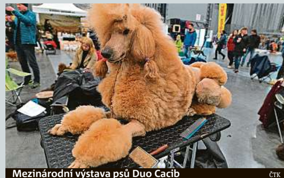
Mezinárodní výstava psů Duo Cacib