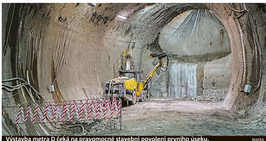
Výstavba metra D čeká na pravomocné stavební povolení prvního úseku.

Důvodů pro navýšení je několik. Největší problém je inflace a obecně růst cen v posledním období tří let. Původní náklady 39 miliard korun byly odhadnuty v roce 2011