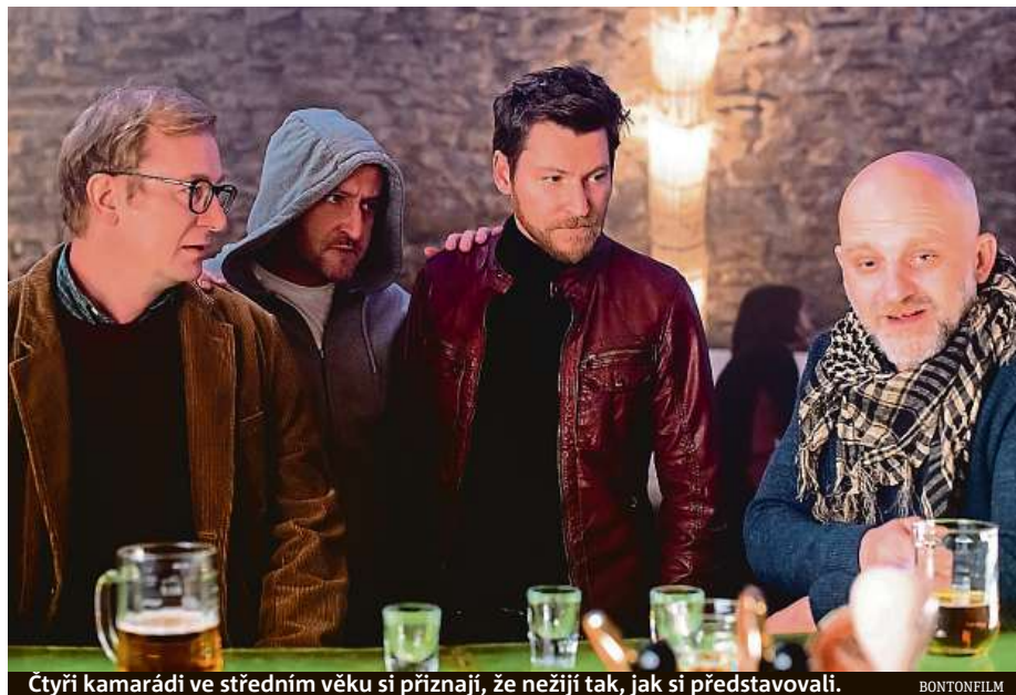
Čtyři kamarádi ve středním věku si přiznají, že nežijí tak, jak si představovali.