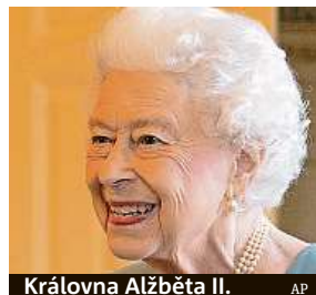
Královna Alžběta II.

Oslavy vyvrcholí na začátku června, kdy je budou doprovázet koncerty a pouliční akce. Královně poslalo gratulace k výročí mnoho dalších významných osobností Británie. HAL a ČTK