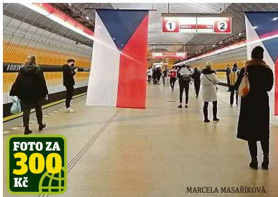
FOTO ZA 300 KČ