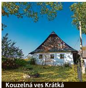
Kouzelná ves Krátká