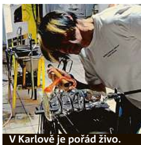
V Karlově je pořád živo.

Původní malé sklárny, které fungovaly na Vysočině v 16., 17. a 18. století, patřily místním šlechtickým rodům a mistrům sklářům. Pokud se vydáte po jejich stopách, dostanete se do půvabných vesniček s kouzelnou architekturou patřících do památkové rezervace. V jejich okolí se navíc nachází unikátní příroda