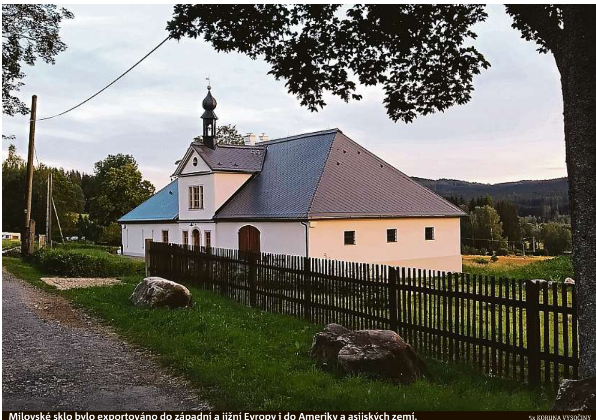
Milovské sklo bylo exportováno do západní a jižní Evropy i do Ameriky a asijských zemí.