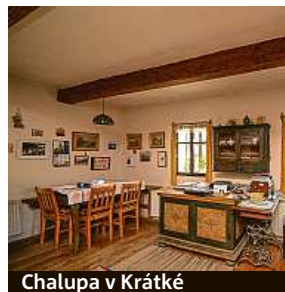
Chalupa v Krátké

CHKO Žďárských vrchů. Sklářskou historii Křižánek dokládají nálezy kolem domů, jako jsou střeby nebo struska. Třeba budete mít štěstí a nějaký vzácný úloemek najdete i vy. Malebná vesnička vás okouzlí nejen svou architekturou, ale také okolní přírodou. Spojte návštěvu s výletem na tajemné