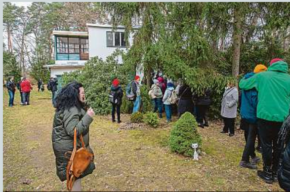
Obrovský zájem. Hrabalovu chatu si chtěly prohlédnout stovky lidí.

bala. Zájem byl velký, před domem se sešly stovky lidí. Prohlédly si chatu a její okolí, kde spisovatel žil a psal své knihy. Zprístupněna byla při příležitosti výročí Hrabalovy smrti, od níž ve čtvrtek uplynulo 25 let. Polabské muzeum sem chce přestunout větší část pozůstalosti. Chata se zatím bude otevírat jen při výjimečných příležitostech. ČTK