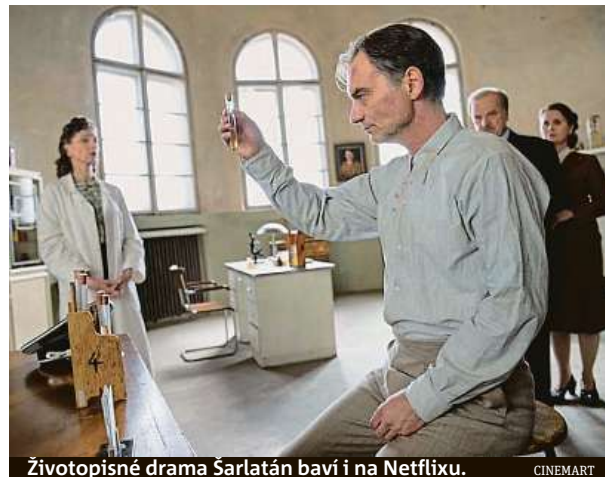
Životopisné drama Šarlatán baví i na Netflixu.

Václav Havel je bezesporu tak významnou českou osobností, že se o jeho filmový (ne-