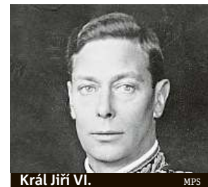
Král Jiří VI. MPS

Britský princ Charles včera vzdal hold královně Alžbětě II. u příležitosti 70. výročí od jejího nástupu na trůn.