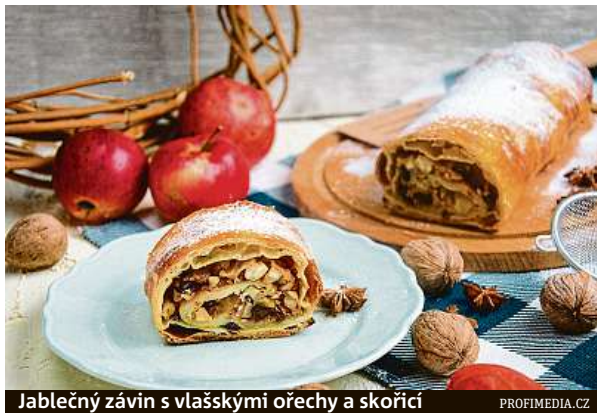
Jablečný závin s vlašskými ořechy a skořicí

Postup: Z připraveného těsta vytáhneme dva nebo tři tenké pláty těsta. Necháme je trochu oschnout a potřeme zchladlým máslem. V míse prošleháme tvaroh, smetanu, žloutky, špetku soli, vanil-