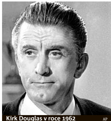
Kirk Douglas v roce 1962