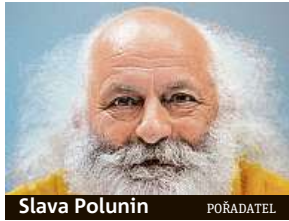
Slava Polunin POŘADATEL

Světově proslulý ruský umělec a klaun Slava Polunin přijede do Prahy se Sněhovou show známou také jako Slava's Snowshow. S tou umělec slaví úspěchy už od roku 1993 a viděli ji miliony diváků. V Česku se představí v Divadle Hybernica. Unikátní představení, které získalo dvacet mezinárodních ocenění včetně ceny Laurence Olivierova za nejlepší zábavný program a ceny Drama Desk, se tady odehraje jen sedmkrát, a to od 4. března do 8. března.