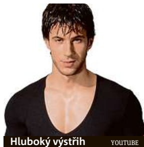
Hluboký výstřih YOUTUBE

Tím, že ukážete trochu více hrudníku než třeba v roláku