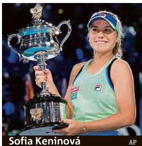
Sofia Keninová

Lotyšky zkusí Američankám vzdorovat s někdejší vítězkou Roland Garros a světovou čtyřicítkou Jelenou Ostapenkovou. I v dalších zápasech jsou v nominacích elitní hráčky. Nizozemky spoléhají na Kiki Bertensovou, proti nim bude stát Bělorusko s Arynou Sabalenkovou. Rumunkám chybí Simona Halepová a favoritkami tak jsou