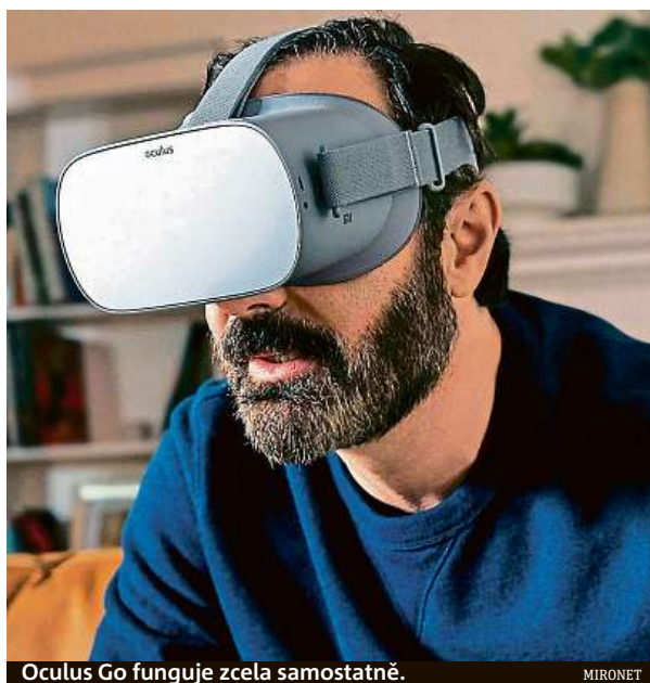
Oculus Go funguje zcela samostatně.

Firma Oculus nedávno uvedla na trh autonomní systém Oculus Go. Na první pohled zařízení připomíná klasické brýle pro virtuální realitu. Nevedou z něj ale žádné kabely ani k němu není nut-