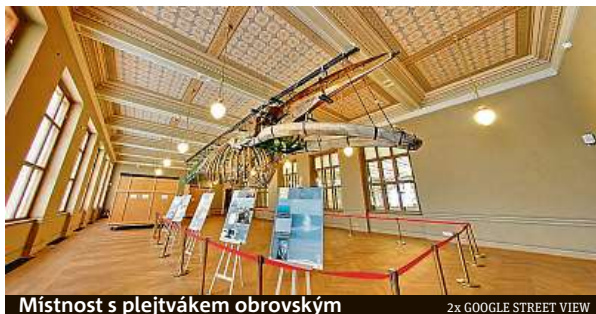
Místnost s plejtvákem obrovským

Google spustil službu před 15 lety. Prostřednictvím Street View je nyní zmapováno přes 16 milionů kilometrů měst, památek nebo i interiérů významných kulturních institucí. Uživatelé si tak mohou prohlížet 360stupňové snímky ulic různých