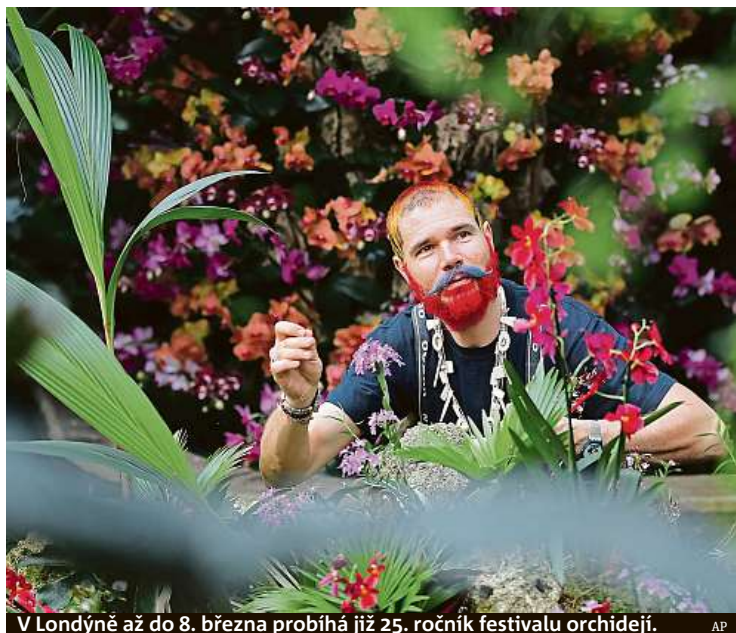
V Londýně až do 8. března probíhá již 25. ročník festivalu orchidejí.

Pojistné podvody. Výrazně narůstá počet týkající se automobilů. Bez zábran. Lidé se snaží vydělat třeba i na smrti bližního. Nový trend. Filutové chtějí získat finanční náhradu například za vlastní „blbost“ STRANA 6