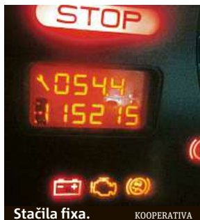
Stačila fixa. KOOPERATIVA

Kooperativa řešila případ rodiny s „velmi nešikovným“ nezletilým synem. „Opakovaně rozbíjel sousedům a známým rodiny mobilní telefony a notebooky. Kuriózní byl poslední nahlášený případ. Chlapec měl na návštěvě