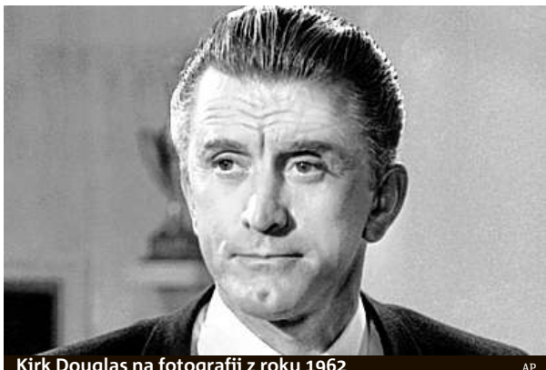
Kirk Douglas na fotografii z roku 1962

Na úmrtí hollywoodské legendy reagovalo mnoho filmových tvůrců. „Kirk si udržel herecké charisma až do