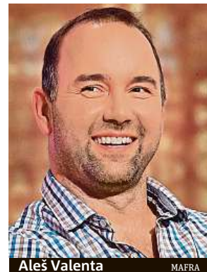
Aleš Valenta MAFRA

Ze zim bez sněhu je smutný Aleš Valenta. Olympijský vítěz ze Salt Lake City z roku 2002 v lyžařské akrobacii to přiznal v pořadu Tři Impulsy na tělo. Teď sice na horách nepadlo, ale předpověď ukazuje spíše na oteplení a Valenta to dobře nevidí ani do dalších let. „Podle mě ta perspektiva je velice bídná. Podmínky v českých lokalitách se budou zhoršovat a zhoršovat. Já ale věřím tomu, že je to nějaký výkyv,“ prohlásil Valenta. Aleš Valenta předpovídá, že lyžařské areály, zvláště ty níže položené, budou mít během následujících let velké ekonomické problémy.