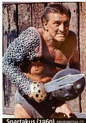
Spartakus (1960)

Kirk Douglas se narodil jako Issur Danielovitch (rusky Iser Danijelovič) v Amsterdamu ve státě New York do rodiny chudých židovských přistěhovalců z oblasti nynějšího Běloruska. Od mládí se věnoval divadlu, boxu a řecko-římskému zápasu. Absolvoval také hereckou přípravu na Americké akademii dramatických umění v New Yorku a v roce 1941 se objevil poprvé na Broadwayi. U filmu debutoval v roce 1946.