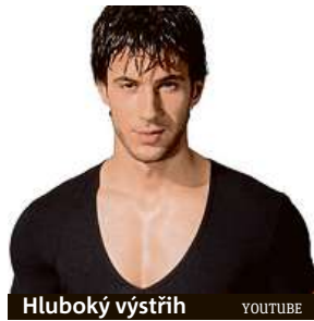
Hluboký výstřih YOUTUBE

Tím, že ukážete trochu více hrudníku než třeba v roláku