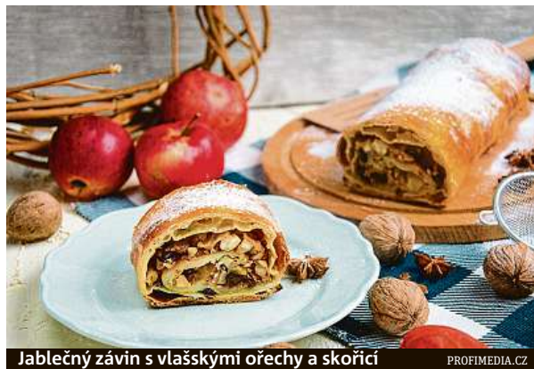
Jablečný závin s vlašskými ořechy a skořicí

Postup: Z připraveného těsta vytáhneme dva nebo tři tenké pláty těsta. Necháme je trochu oschnout a potřeme zchladlým máslem. V míse prošleháme tvaroh, smetanu, žloutky, špetku soli, vanil-