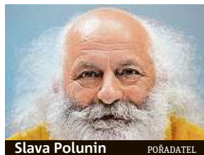
Slava Polunin POŘADATEL

Světově proslulý ruský umělec a klaun Slava Polunin přijede do Prahy se Sněhovou show známou také jako Slava's Snowshow. S tou umělec slaví úspěchy už od roku 1993 a viděly ji miliony diváků. V Česku se představí v Divadle Hybernia. Unikátní představení, které získalo dvacet mezinárodních ocenění včetně ceny Laurence Olivierova za nejlepší zábavný program a ceny Drama Desk, se tady odehraje jen sedmkrát, a to od 4. března do 8. března.