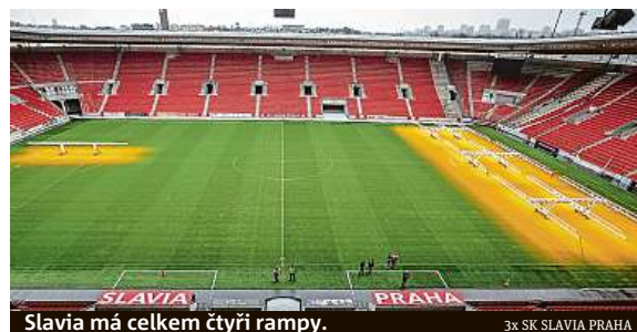
Slavia má celkem čtyři rampy.

Osvětlení je v provozu takřka nonstop. „Děláme maximum pro to, aby na jaře byl v Edenu kvalitní povrch. Vzhledem k tomu, že zároveň jede celou zimu i vyhřívání trávníků, nemělo by napadnutí sněhu vadit, nicméně při velké sněhové bouři se přírodě neubráníme,“ říká Býček. O přístroje se starají slávističtí trávníkáři a zároveň provozní oddělení. MAREK HÝŘ