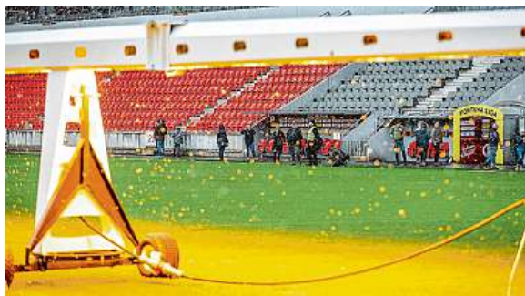
Rampy si zájemci prohlédli během víkendu otevřených dveří.

V závěru podzimu byly na trávníku Slavie značné srážky. Klub proto investoval do osvětlovacích ramp.