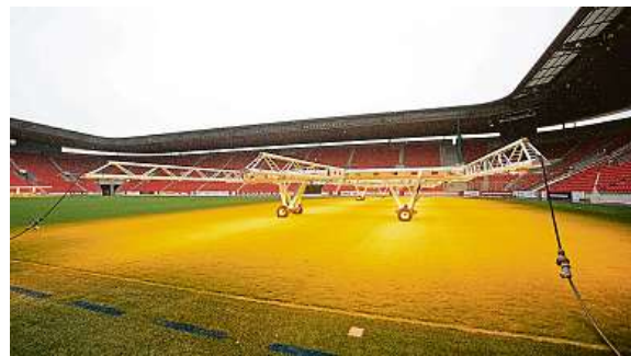
Tři rampy pokryjí celé brankoviště (1320 metrů čtverečních).

Arsenal, Chelsea, Dortmund či Real Madrid využívají na svých stadionech osvětlovací rampy SGL. Moderní technologii má nyní také pražská Slavia.