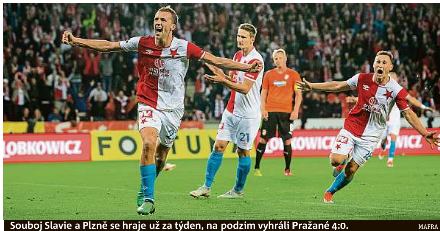
Souboj Slavie a Plzně se hraje už za týden, na podzim vyhráli Pražané 4:0.