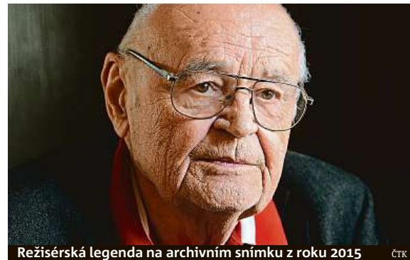
Režisérská legenda na archivním snímku z roku 2015