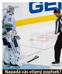
Napadá vás vtípný popisek?

Napište bublinu a reagujte na sloupek na: www.facebook.com/denikmetro