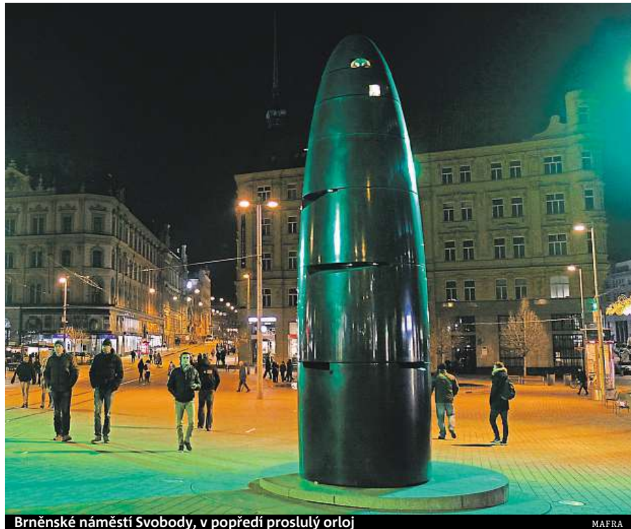
Brněnské náměstí Svobody, v popředí proslulý orloj