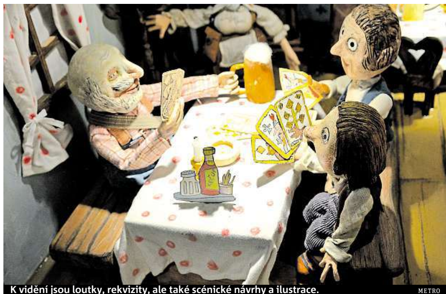
K vidění jsou loutky, rekvizity, ale také scénické návrhy a ilustrace.