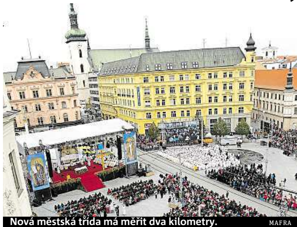
Nová městská třída má měřit dva kilometry.

Vyžadoval by bourání domů, jaké Brno posledních čtyřicet let nezažilo. Má vést od náměstí 28. října po Traubově, Příční a průmyslovými brownfielody, přetnout Cejl a Křenovou a končit u ulice Zvonařka, měřil by více než