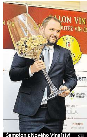
Sampion z Nového Vinařství