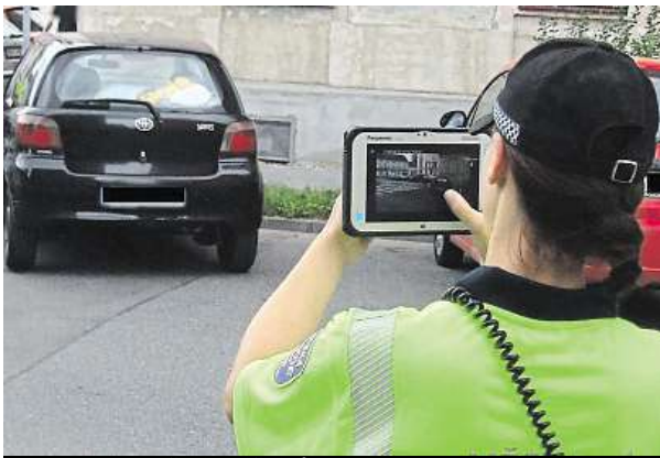
Tablety usnadňují strážníkům práci.

„Dříve musel strážník vysílačkou ohlásit dispečinku poznávací značku, aby se dozvěděl, komu vůz patří a zda